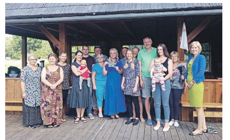
Rahvastikuminister Riina Solman Nedsajas.