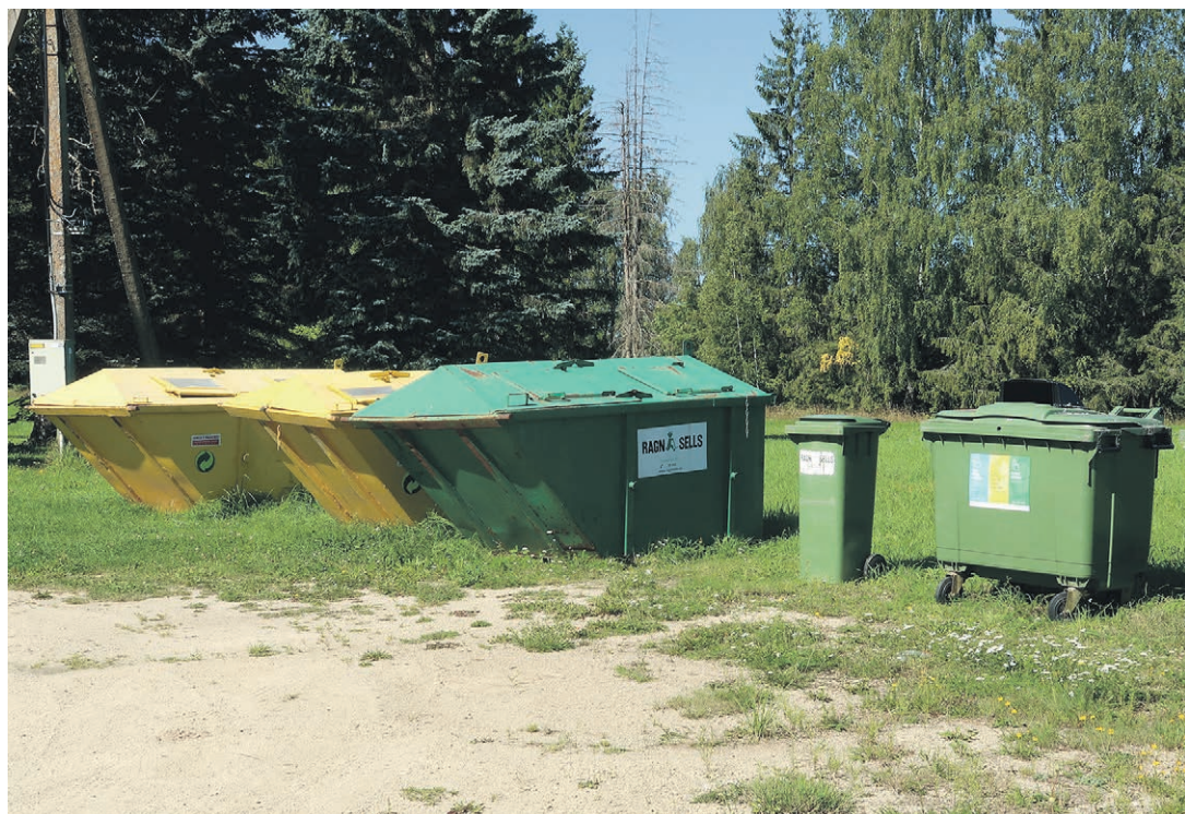
Obinitsa Külakeskuse kõrval on esindatud kõik tavaprügi sorteerimise konteinerid.