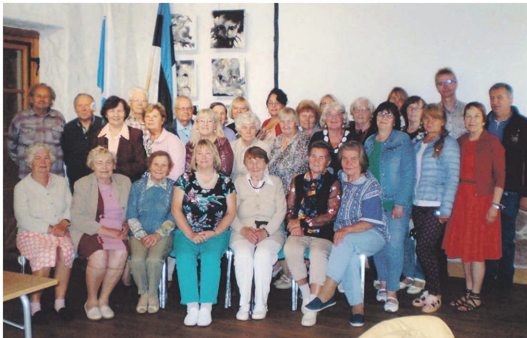
Petseri kooli kokkotulõk.