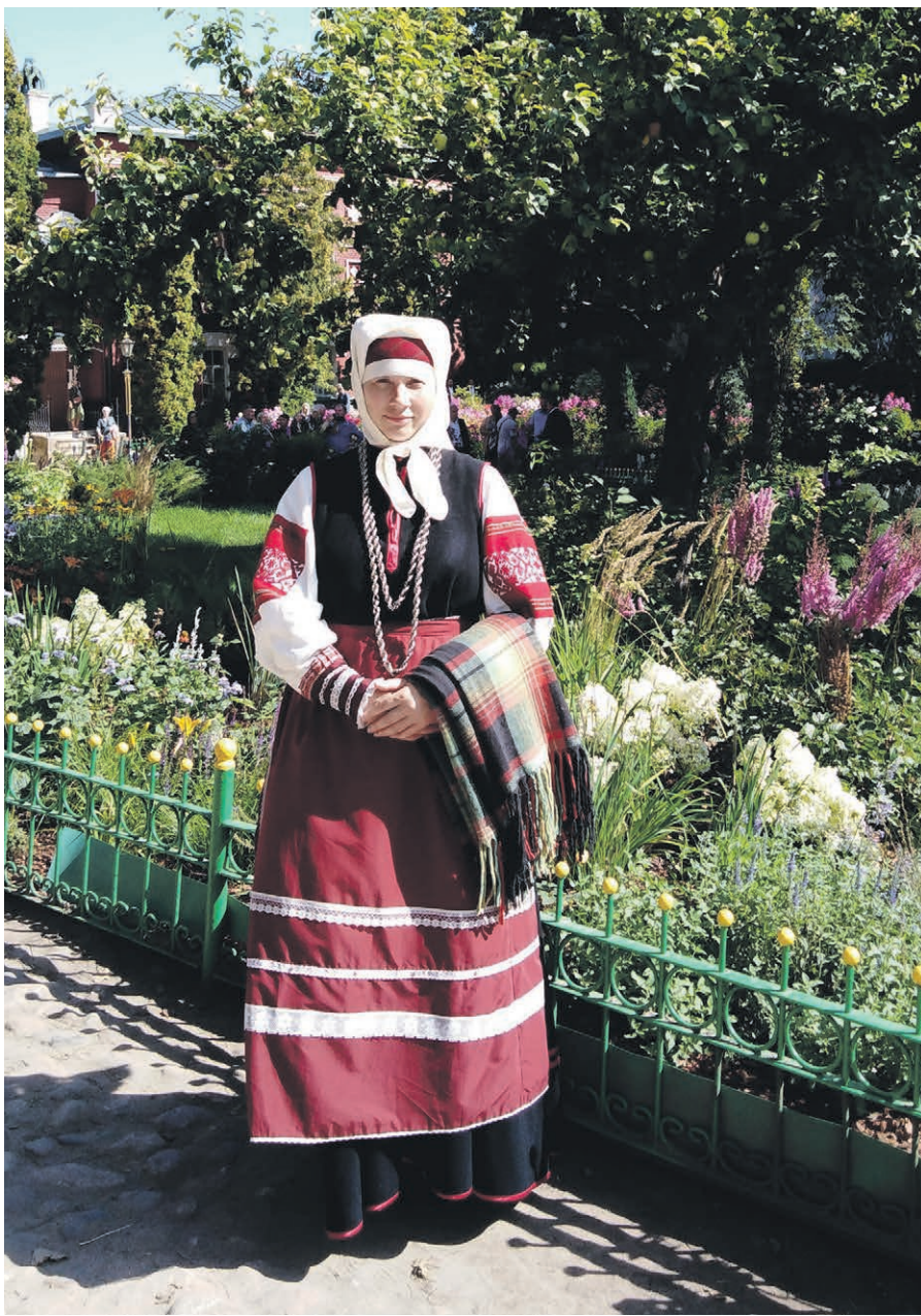
Ojametsa Lea kloostrih.

Lätsi ma sis kapi mano, naksi sortma: mitu liniket, vanõmbit, vahtsõmbit ni valu-vahtsit, koedu otsaki külge umbõlmalda viil, linige vee-reh valgõ' heegelpitsi'. Mõtli, kai. Üts oll' vana, nii vana, a nii