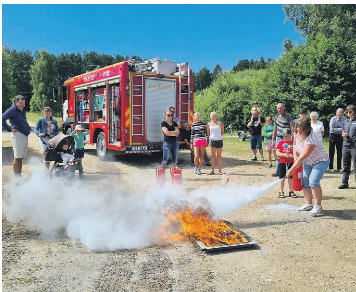
Juulis õpetati külaelanikele, kuidas ohtusid ennetada ja ohulukorras käituda.

Eesti Post kutsus juunikuus kogukondi üles grupipostkaste paigaldama. Tänu kampaniale on Lobotka külas seitse uut grupipostkasti.