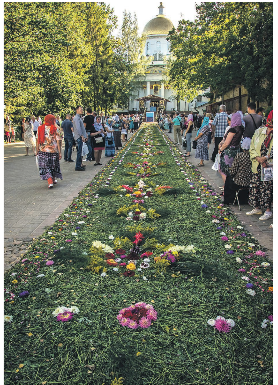
Lillitii Petsere kloostrih.