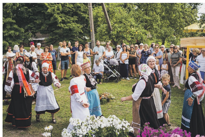
Kostipäev kohvikus Helmeakaala' Polovinah.