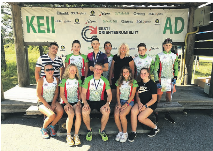
Värskä OK Peko orienteerujad.