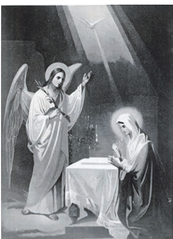
Maarä ilmutaminõ. Postkaart, Petseri 1936.

Suurt maaräpäivä kutstas Setomaal rüämaaräpäiv, vin-