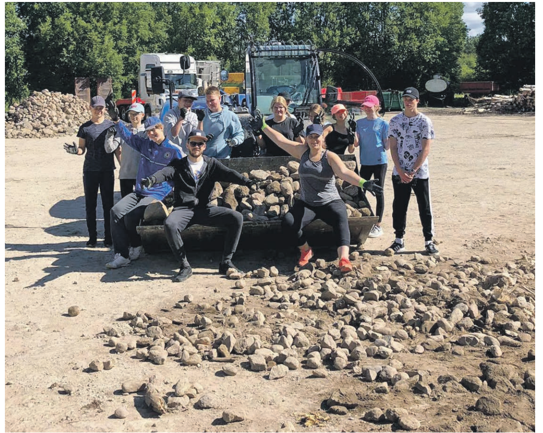
Meremäe rühm Lõuna-Antsu taloh kivve vidämāh.

Pääl tüü tegemisõlõ vabal aol nä mängõ' ütehuuh, võimlõ', tandsõ', kõrraldi' filmikaemisõ õdagit, käve' tõisi malõvarühmil külāh, käve' ojomah, Meenikunno rabah, käve' kaemah Sillapää lossi parki, olli' Peipsi järvefestivaalil, Verska piirivalvõkordonih, kummipaadiga' sõidõti müüdä Võhandu jõkõ, olti Moostõh