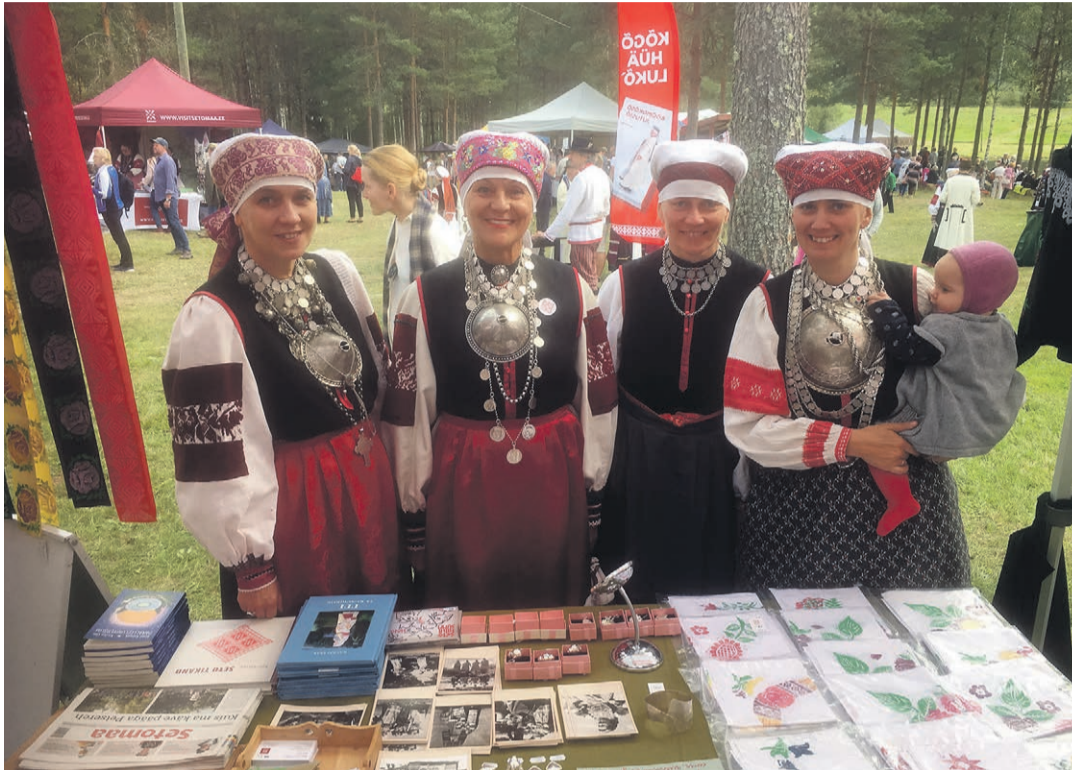
Nedsjä laulunaase' Kolossovah.

Sootska Höti tulõ üttele Kroonikogoga Petsere maastõrakelli helü saatõl Jumalamäelt alla Piusa jõe perve poolõ, koh om timahavadsõ kuningriigi-