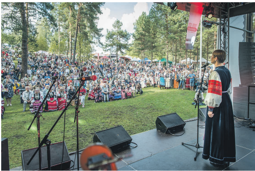
Sõbraligu naaberrigi pää käve Seto Kuningriiki tervitämäh.