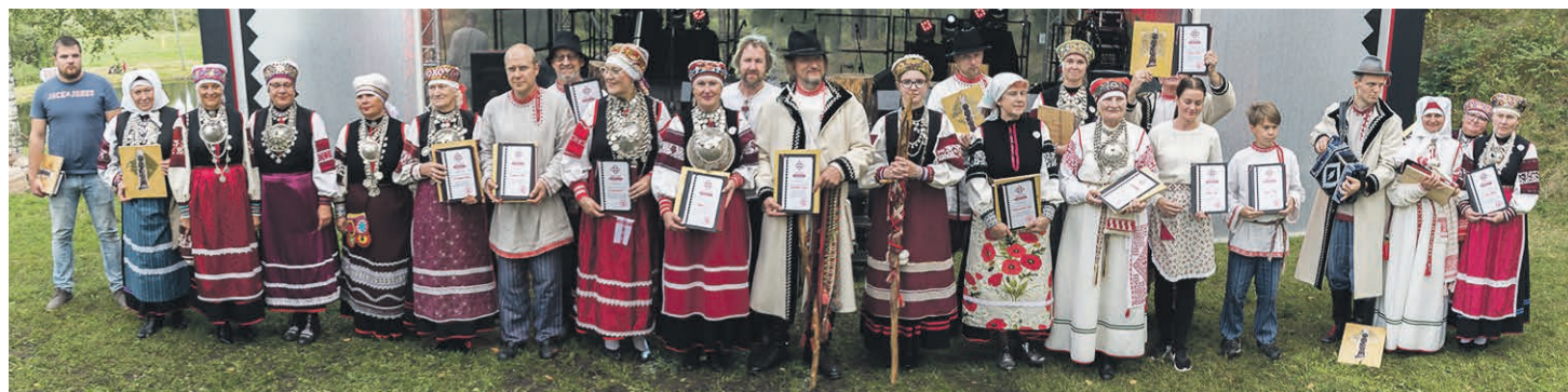
Seto Kuningriigi meistri'.