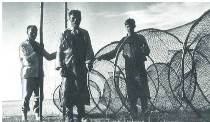
Peipsi kalamehe' mõrda kuivatamah. 1940.

rä otsa ja tuu ridva külge. Tetti eis', a sai ka poodist vai laado päält osta'. Õngõtsänkõ hoiõti kotoh villadsõ närdsu seeh vai karbikõsõh, õngõnüürä papi- tüükü seeh. Ku oll' rossõhe län- nü, puhastõdi liiva vai tuhaga hõõrtõh.