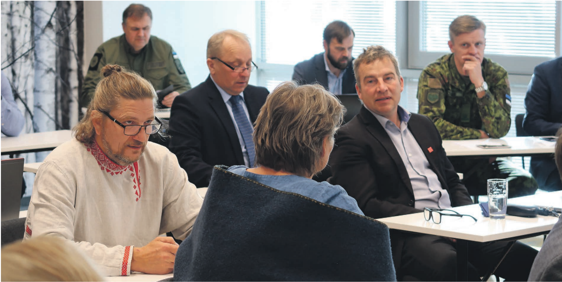
Kagu-Eesti valitsuskomisjoni nõupidamine Värskas.