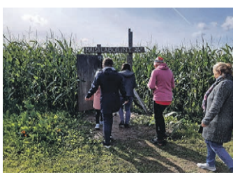
Õpilased ja õpetajad sisene- vad maisilabürinti.

11. septembril käis Miki- tamäe Kooli pere Põltsamaal seiklemas. Kõigepealt võt- tis meid vastu Toretalu pere- naine. Uueväljal asuv pisike talu on tuntust kogunud eel- kõige oma maisilabürintide- ga, kuid seal on palju muudki põnevat – hiiglaslikust diiva- nist paljajalarajani välja. Õpi- lased tutvusid taluloomadega, jätsid oma mured kivilabürin- di südamikku ning õppisid ise