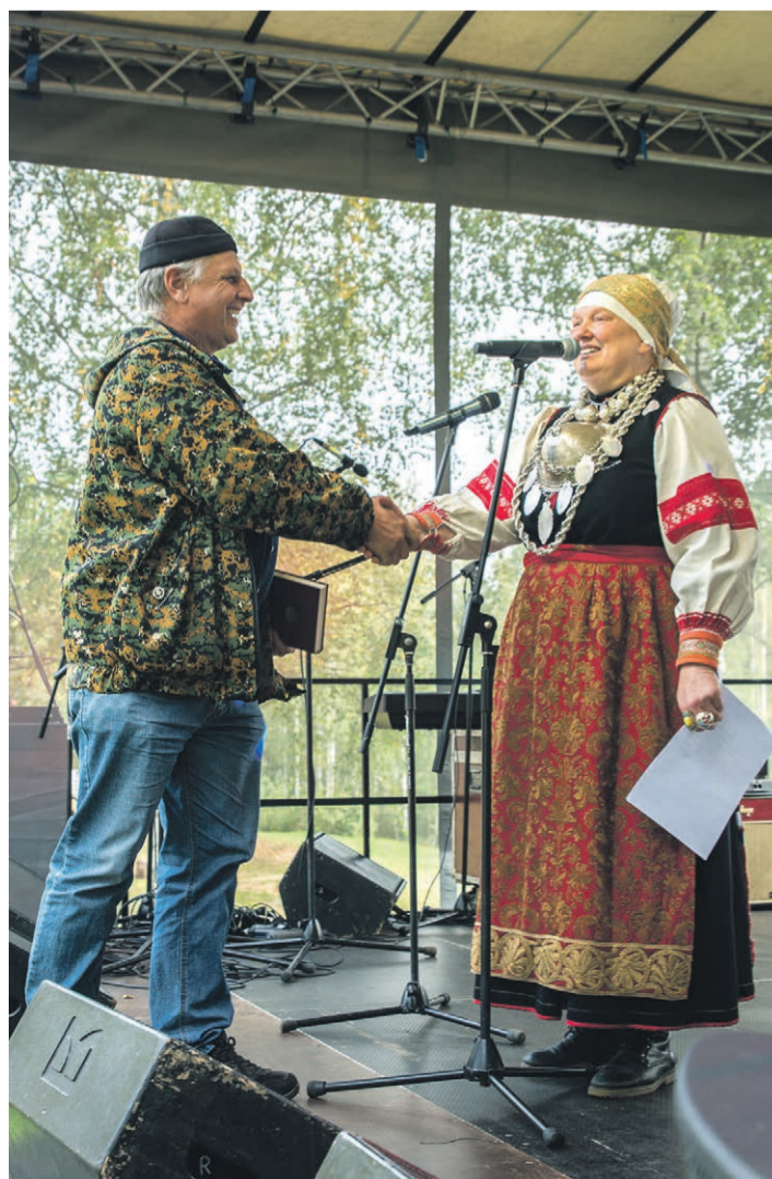
Järve Väinõtt tennäti aolehe kirändüsvoistlusõl hüä esinemise iist.