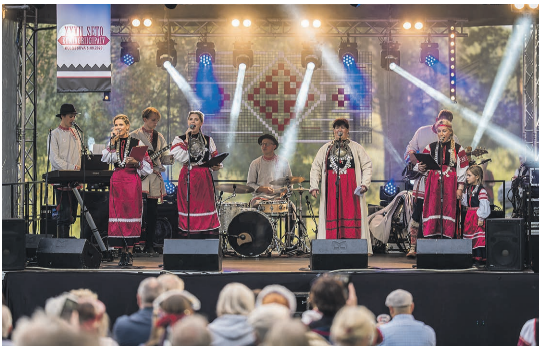
Seto muusiku' Kuningriigi laval.