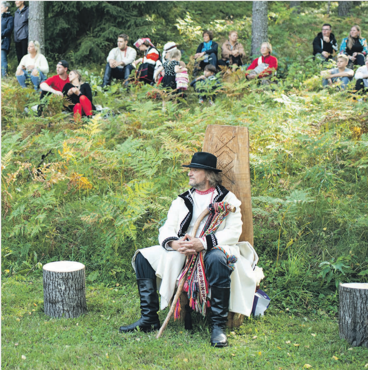
Ülembsootska pidä Pekoga nõvvu.