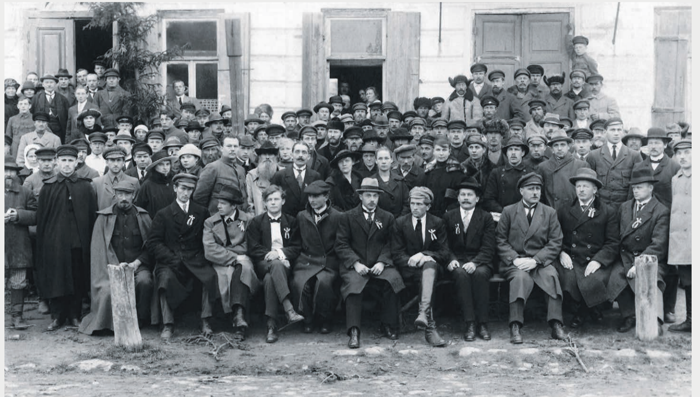
I Seto Kongress Petserih 9. ja 10. oktoobrill 1921.