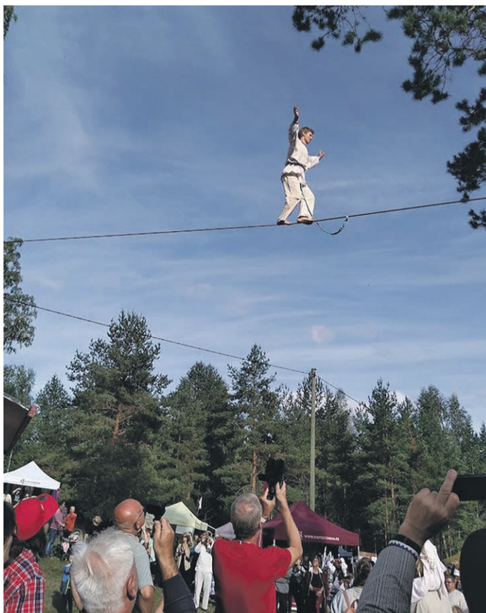
Kablakargus üle Kuningriigi.

Sootska Höti tahasi minnä' süüke ja juukõ maitsma, a saa-ai kuigi. Vaia küläpüüne vedosniguna tah sehkendä' ja pillimehenä tukõ' üttele leelo-