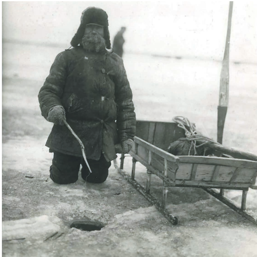
Vinne kalamiis Peipsi pääl. 1924.

Kallo püvveti Piusa jõõst õngõga. Püvveti haugõ, ahuni, säänit. Nuu', kiä' ell' jõe- veereh vai ka koh kavvõmbah, hoiji' õks kotoh õngi vai väst- rit (vigla muudu püügiriist). Inämbüistõ olli' kalapüüdjäst poiskõsõ' jõeveeritsidõ niitõ pääl, vahel ka aigu oll' käve' ka suurõ' inemisõ'. Õngõ rav- vast tsängukõsõ' kintedi nõõ-