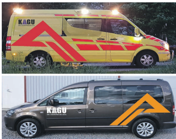
Sellised näevad välja teenust osutavad sõidukid.

Sõit telli vähemalt kaks töö- päeva ette, see annab õiguse teenust saada sulle vajalikul