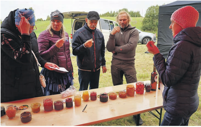
Luhamaa külälaadal hoidissit maitsmah.