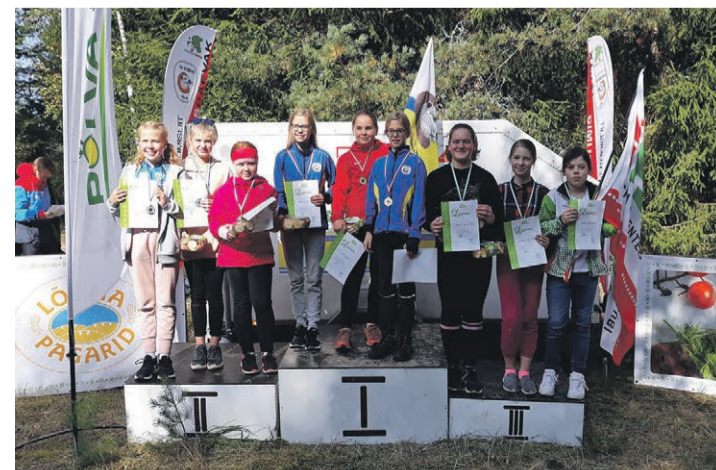
Setomaa valla noorte orienteerumisevõistkond saavutas teise koha.

Kiitus ja tänu kõikidele 44-le Setomaa valda esindanud sportlasele, kes aitasid saavutada väikeste valdade arvestuses kokkuvõttes kolmanda koha.