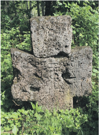
Pilt ristist inne välläkaibmisõ.

Säntsit riste, minkõ laba' läävä' üleväst puult laebast, tei' vanaoaltsõ' Irboska meistri'. Vinne tähti, mia' omma' kivi sisse raot, om mõni viil alalõ. Sääl om olnu' kiri ИСЪ ХСЪ, ЦРЬ СЛ – lühendest sõnnost Исус Христос, Царь Славы – „Jeesus Krõstos, Kuulsusõ valtsõja“ ja sõna НИКА, mia tähendäs Krõstosõ võitu surma üle. Sood mõtõt laulõtas ka' kerkoh: „Kristus on surnuist üles tõusnud, surmaga surma maha tallanud!“ Sõna' omma'