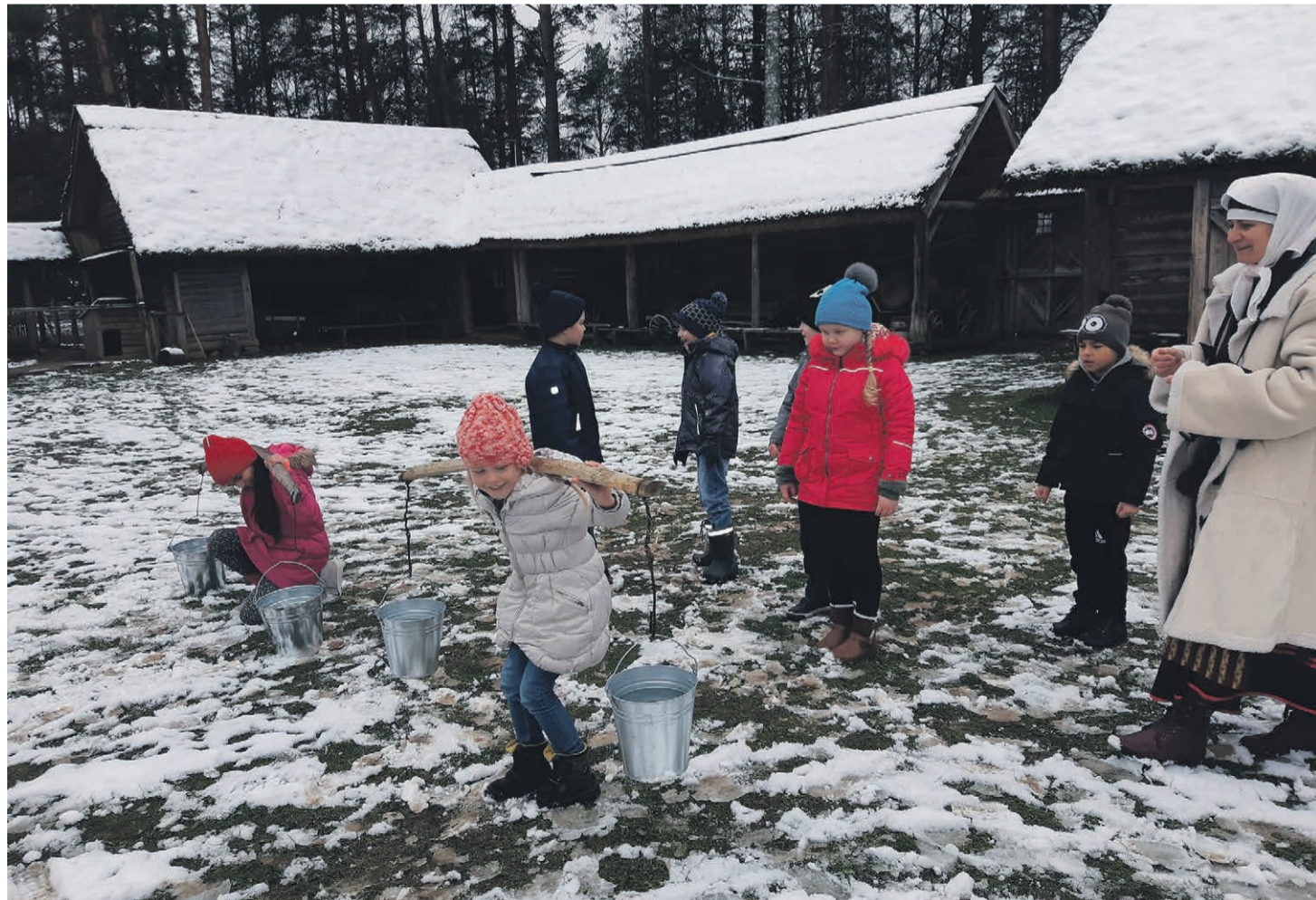
Latsõ moro pääl tallitamah.

Julakõ' mängi' värmeaga' samani, kuis tuud tegevä' latsõ'. Olgõ õkkamuudu ilõlõitsõ!