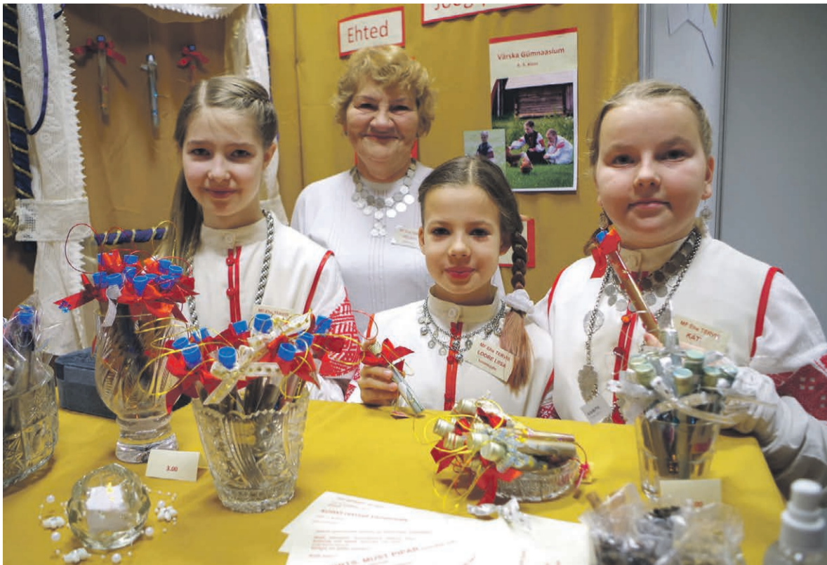
Verska koolilatsi konkurss-laadol tunnustatud žürii parembast Setomaa firmast Verska kooli MF Ehe Tervis.