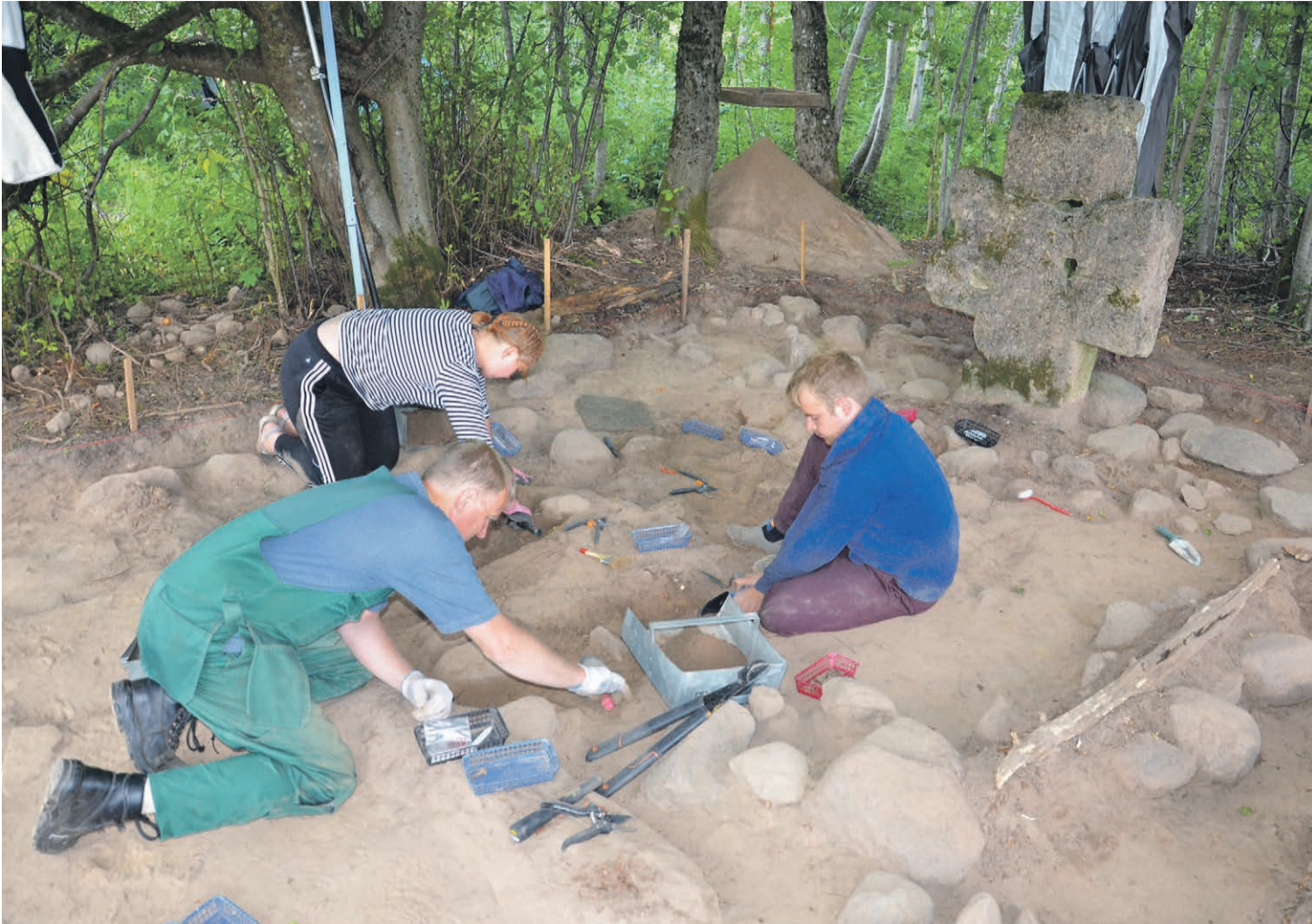
Välläkaibmisõ Viro risti man.

Ku tsassonat inäp hoiõta-as kõrrah, nakas tä aigupiteh lagonõmma. Ka' pühäse', mia' tsassonah olli', kattõ' vai lagosi'. Katus sattõ sisse 1990. aastidõ edeotsah suurõ lumõga': remondimiis, kiä' pand vahtsõ rassõ eterniidikatusõ, oll läbi saagnu' puu', mia' katust toedi'. Laonu hoonõh korstõdi 2000. aastaga keväjä ar'. Sis jäi' tsassonast alalõ õnnõ mädänenü' alomatsõ' palgi' ja suur kivirist. Tuu oll vahesaina takah ja tull vällä sis, ku hoonõh lagosi. Eesti Rahvaluulõ Arhiivih tuust ristist üttegi' jutust olõ-õi.