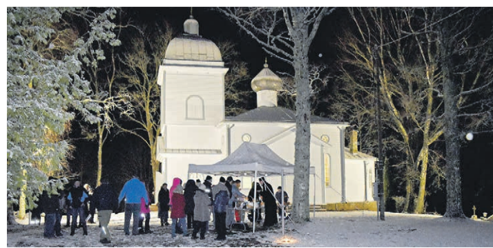
Luhamaa kerf vahtsõh vuudreh.