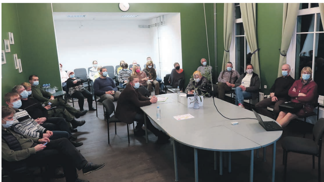
Arutelu külade tsõõriklauaial.

Tsõõriklaua tarvis valminud PowerPointi esitlus on leitav valla kodulehel.