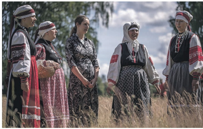
Lummo Kati leelokoor.