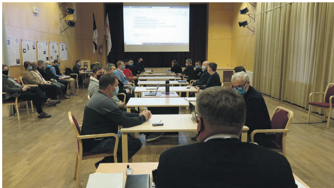
Esimesed vallavolikogu istungid on saanud toimuda kontaktelt ja neid on peetud Värskas kultuurikeskuses.