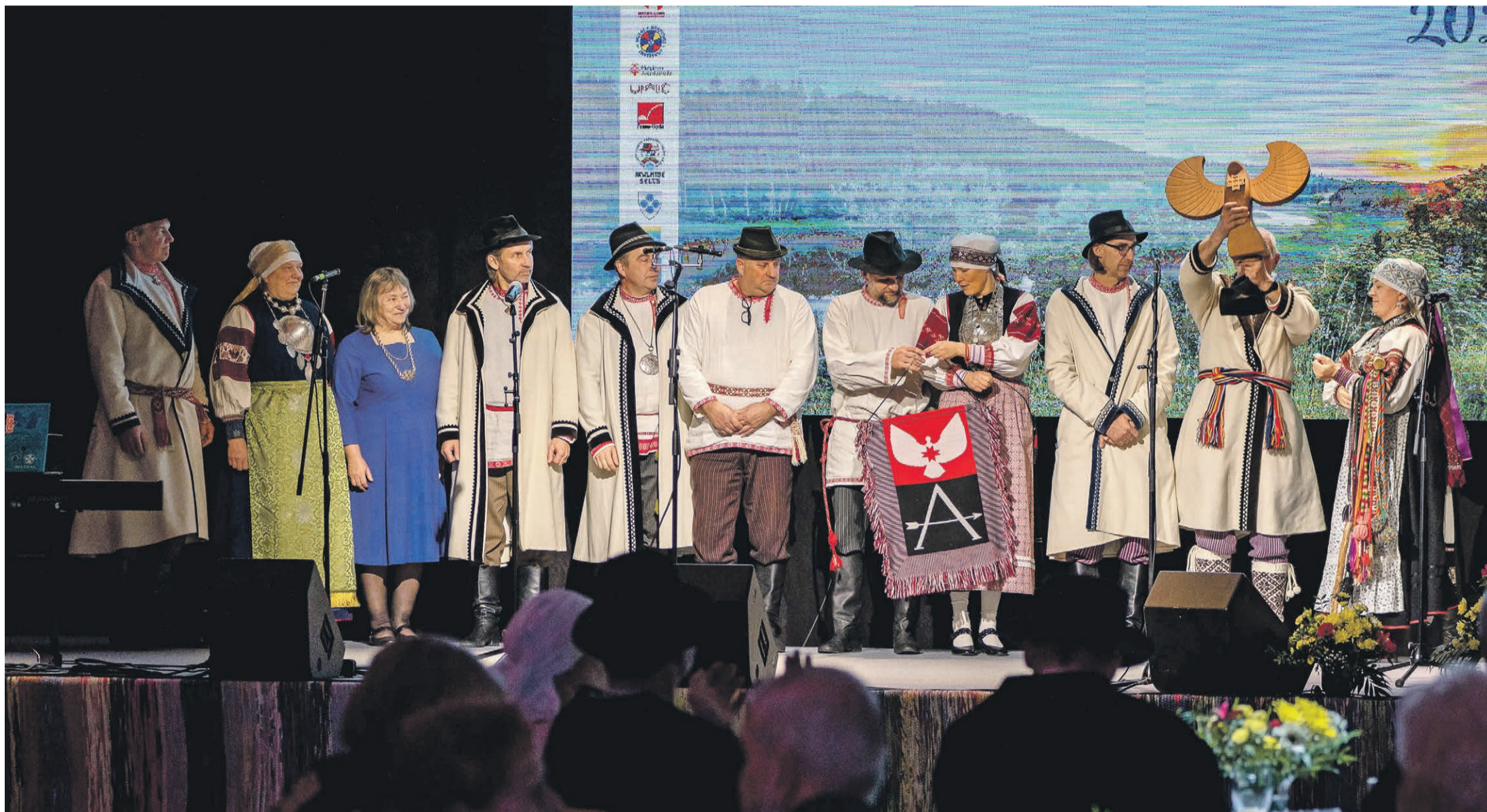
Seto esindüs Abja-Paluoja Somõ-Ugri kultuuripäälina lõpõtamisõl.