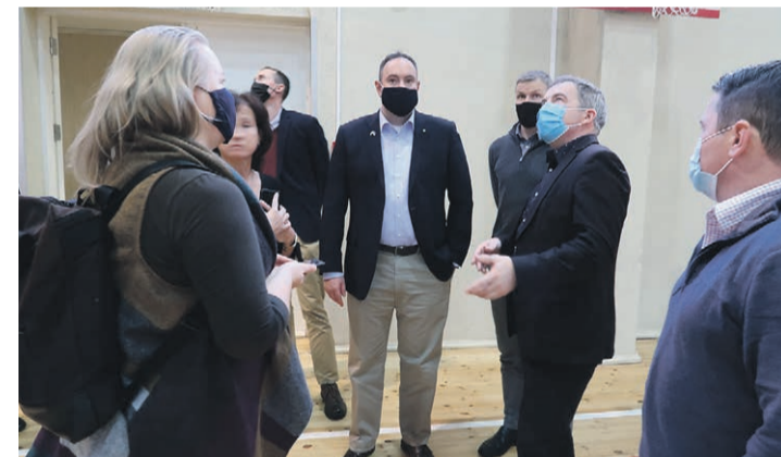
USA saatkonna töötajatele tutvustati erinevaid objekte, mille kaasrahastus tarvilik.

Setomaa vallal on hea meel teha koostööd USA saatkonnaga ja mitte ainult toetuse osas, vaid esitati ka küllakutse tulla tagasi meie piirkonda võludest osa saama. Olgu siis suusa- ja metsaradadele või külastama suvesündmusi.