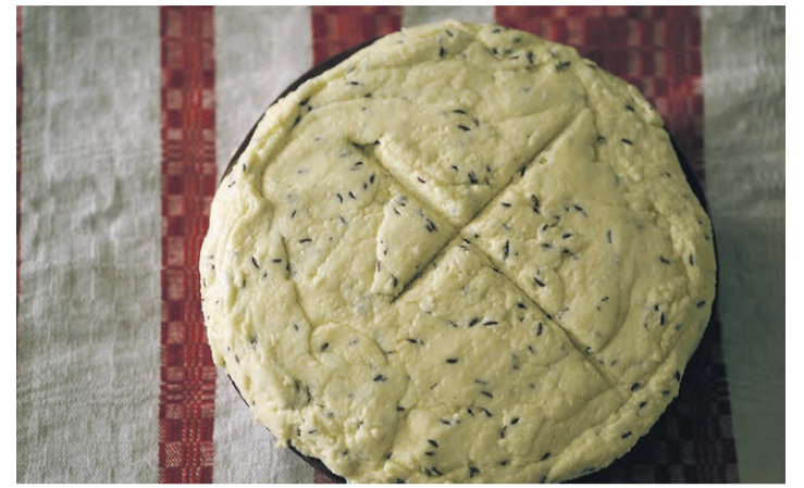
Sõir läts üleilma geograafilisõ toiduperandi nimekirja.