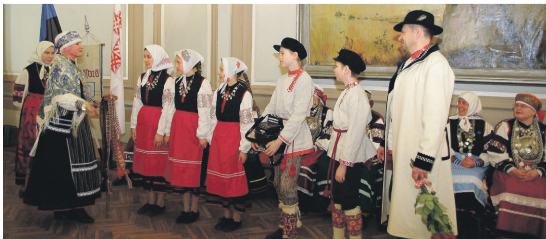
Ülembsootska ja kultuuriklubi Setoluu' tervtäse' Sõsarõ koori.

Pia tull päälõ pilledikontroll ja pallõl mul vaelda' liinibuss näide uma vasta. Ma haari