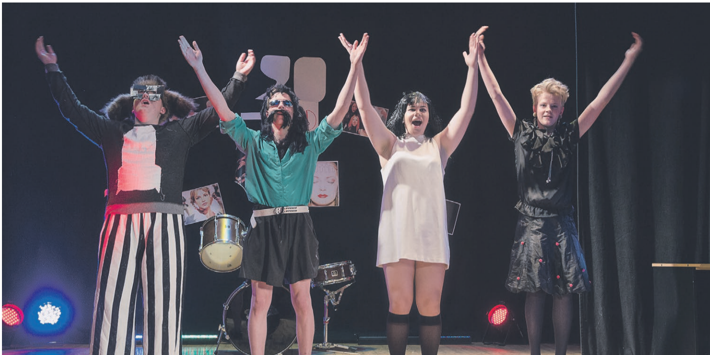
Värskas Gümnaasiumi 9. klassi esinejad.