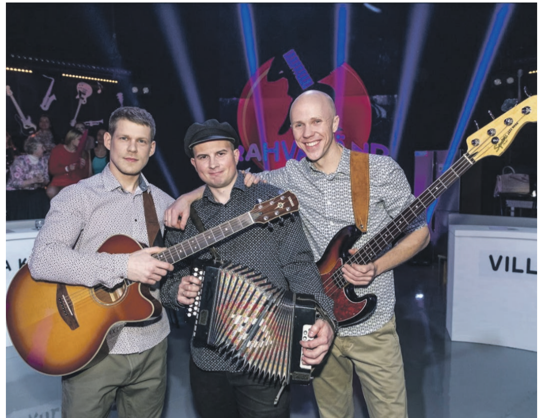
Nedsaja Küla Bänd.