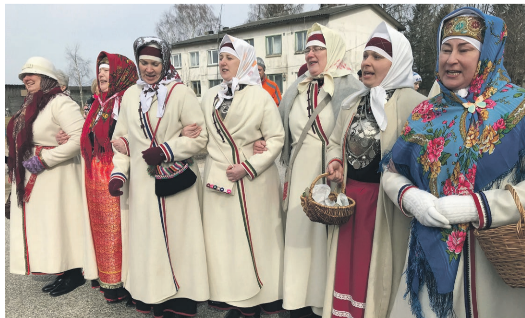
Mokornulga kuur Lihavõõtõpühäl.