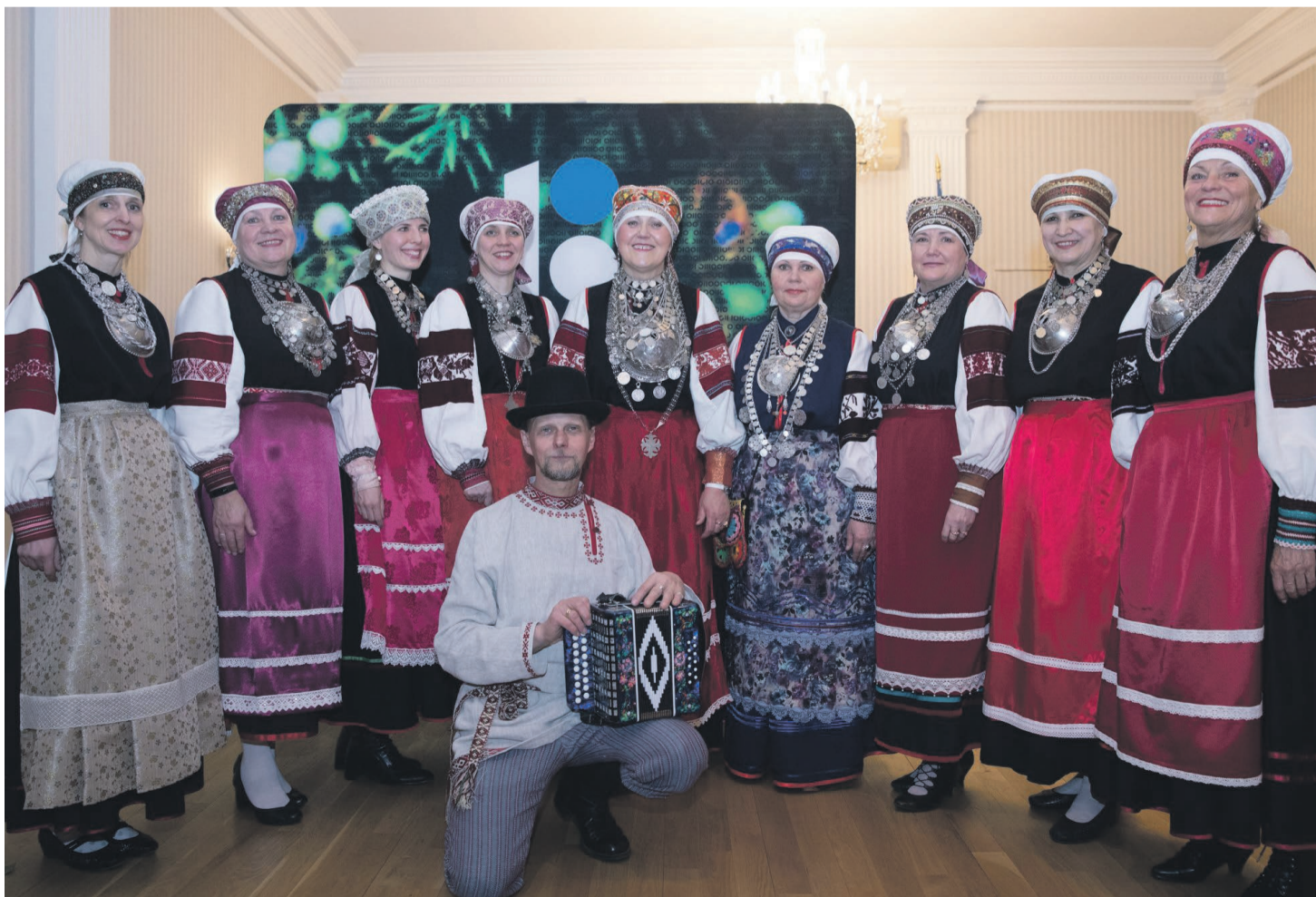
Siidisõsarõ New Yorgih.

Leelopargikõnõ Siidisõsarõ andsõ Ameerikalõ tiidä' seto leelost ja kultuurist ja umast Kuningriigist. Väega suur teno kutsmisõ iist!