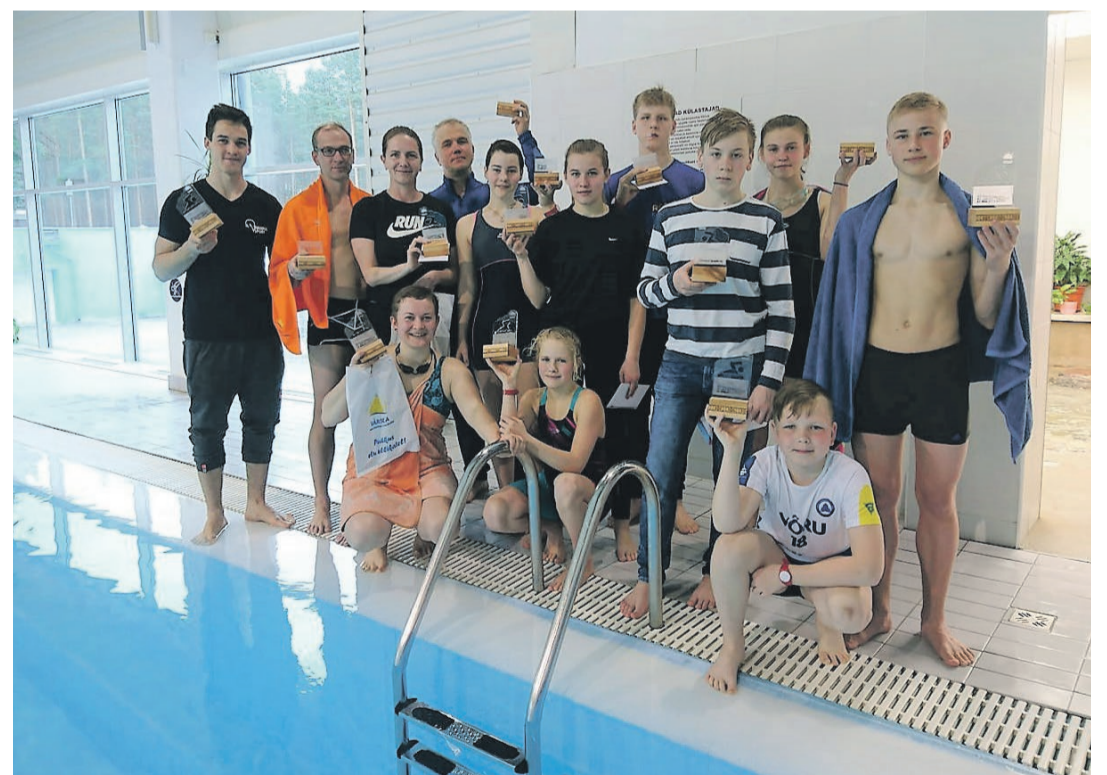
Setomaa lahtised karikavõistlused ujumises 2018.