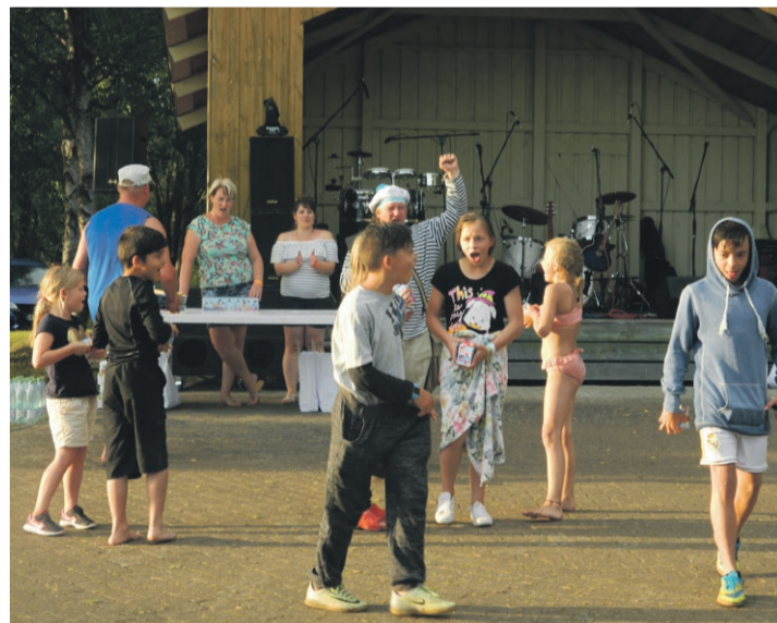
Mikitamäe noored veepeol.

Politsei- ja Piirivalveamet www.politsei.ee ppa@politsei.ee