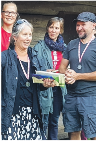
Pillilaagri. Eräkogo pilt.

sere rajoonist ja seto noorõ' Siberäst Krasnojarski kraist.