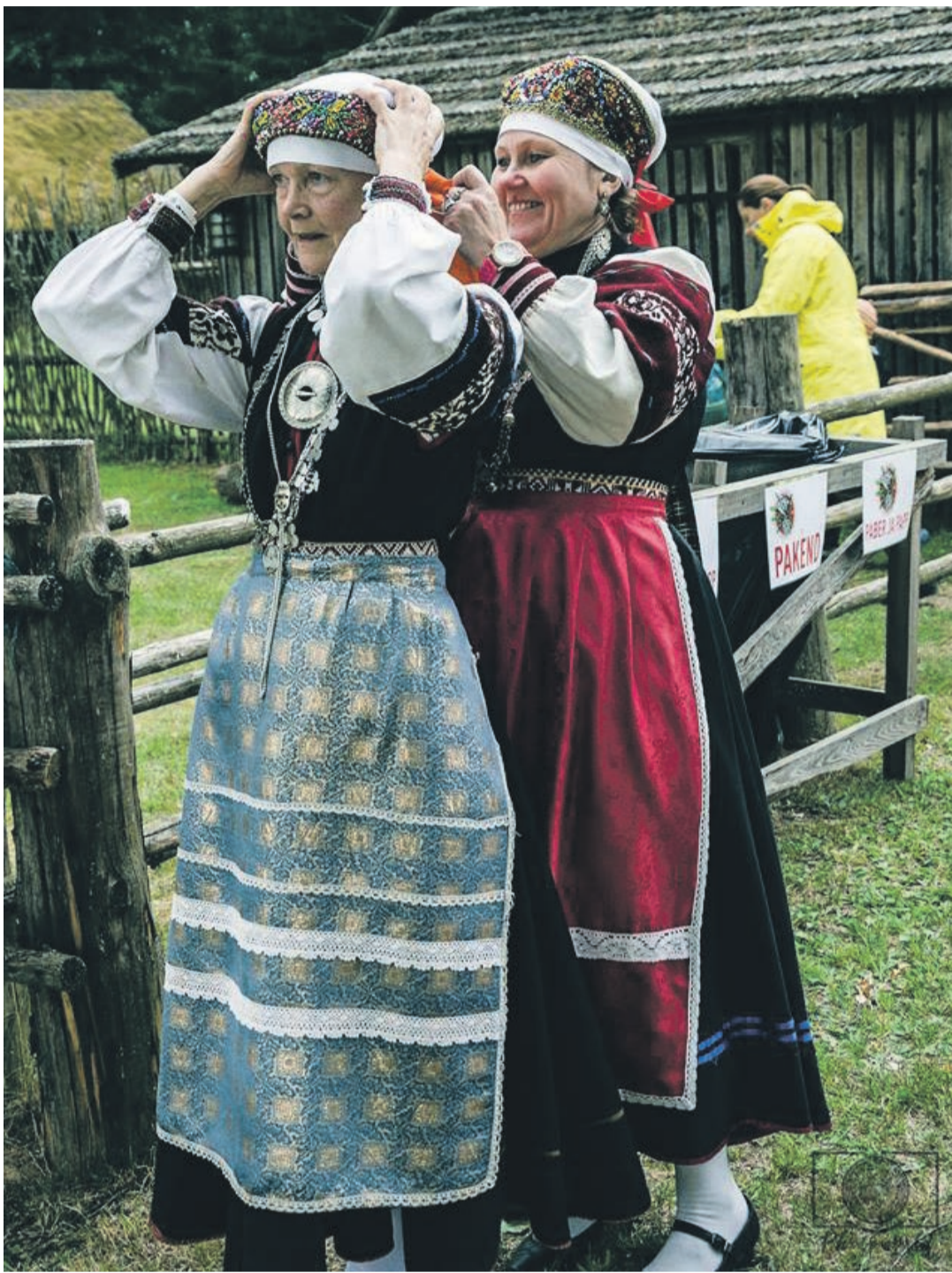
Pää taht säädminist. Seto tandsupidol.