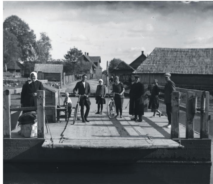
Vööpsõ alevi ja külä vahelinõ praam.

Piiripäääl olõmisõ tunnõh tulõ-õi eishindäst, kiäki' piat inne ütlemmä: panõ' tähele, piir! Kõgõ inäp tiidäs ja saat uma silmäga' nätä' ja ihoga' tunda'