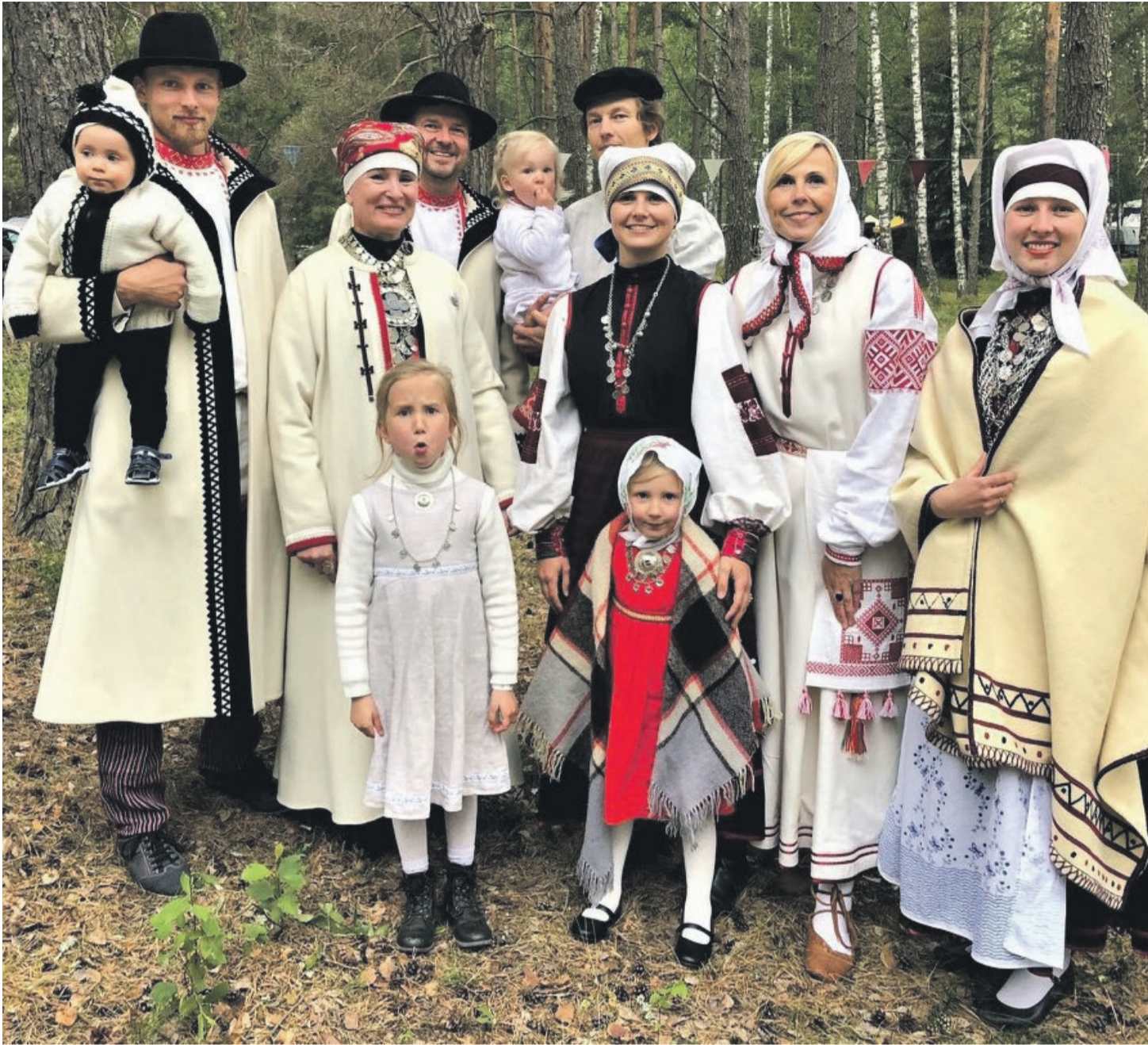
Pireti vanõmb poig ja tütar peredega.