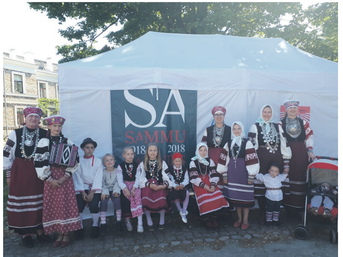
Seto Latsi Kuul Talina Vanaliina Päivi aigi 2018.

Seto Latsi Kooli vahtõõnõ huuaig nakas pääl jälki' septembrih ja kõikõ vahtõõ' setokultuuri huvilitsõ' latsõ' ja näide vanõba' omma' oodõts kõrda kuuh kokko saama. Tiidmissimano lövvät mol' oraamadust grupi alt Seto Latsi Kuul/Seto Laste Kool.