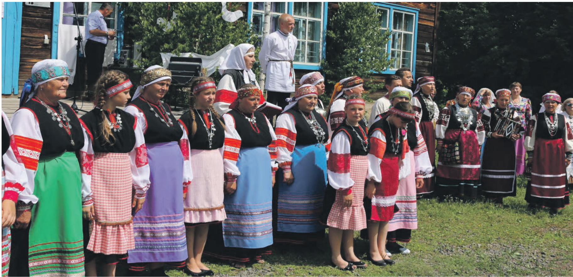
Seto päivil Siberih Haida külãh.

Teimi, mis mõistsõ. Mi sõidu iihmärk ollgi jo toeta', innustã' säälsit setosid nãide tegemish. Tiãmii, õt pããlt tuu, ku sideme' kodo-Setomaa ja Sibere-Setomaa vaihõl tihembã