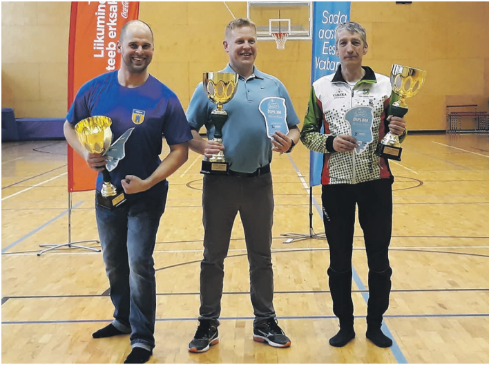
Peipsi talimängudel esikolmikusse jõudnud võistkondade esindajad autasustamisel.