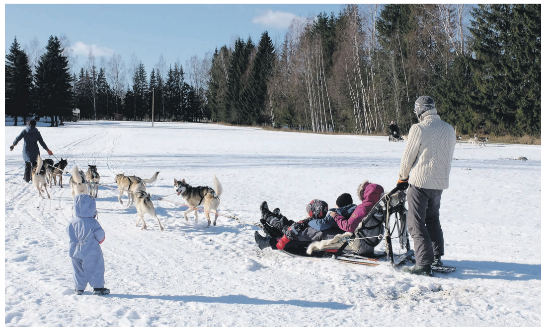
Obinitsah sõidõti pinnega.

Aifumma kõigilõ: nuilõ, kiä' soo laagri kõrraldi', nuilõ, kiä' tüütarriga iist võti', nuilõ', kiä' rahha anni', ni nuilõ, kiä' kohalõ tull'! Tulõvaasta laagri mõttõkõsõ' joba idanõsõ'.