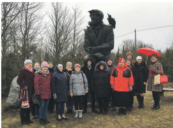
Juhan Smuuliga Koguva küläh.