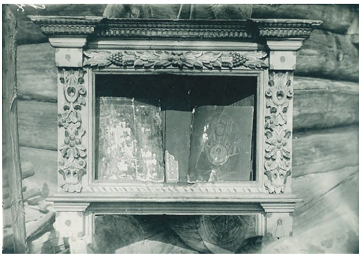
Feodorovi Ivani talo kibot Tsããltsüvãst.