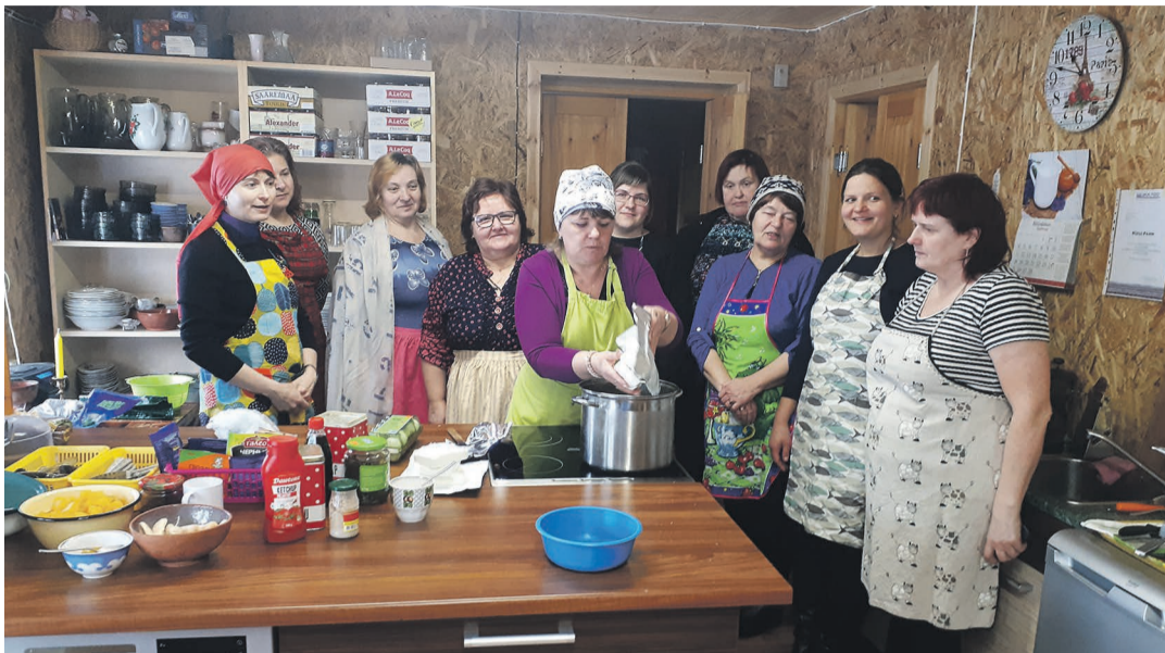
Koolitusprogrammi kuulus ka sõirategu.

Eelviimasel koolituspäeval oli kõigil osalejatel tähtis ülesanne ise midagi teistele õpetada. Igaüks neist viis läbi lühikoolituse mõnel teemal, mis just talle südamele lähedane on. See oli meeleolukas päev, kus me õppisime torti kaunistama, kokteile ja sõira valmistama, sõbrapaela punuma, palmikuid kuduma, näohooldust tegema ja palju muud. Nii palju uusi oskusi ühe päevaga! Sellele päevale tagasi mõel-