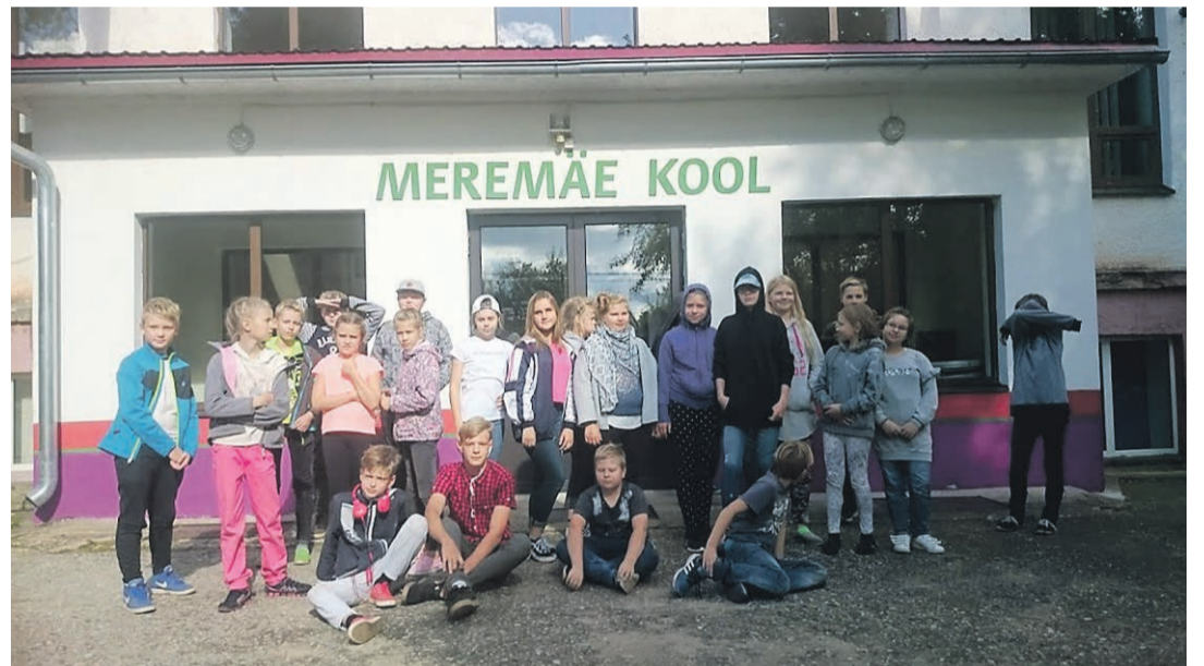
„Noortekohtumine“ Meremäe koolis.

Kuu aja pärast läksime oma partneritele külla Narva, kus korraldasime kohaliku noorteklubi VitaTiim ümbrust, käisime ringi Narva linnuses, orienteerusime linnas ning, nagu ikka, saime palju uusi