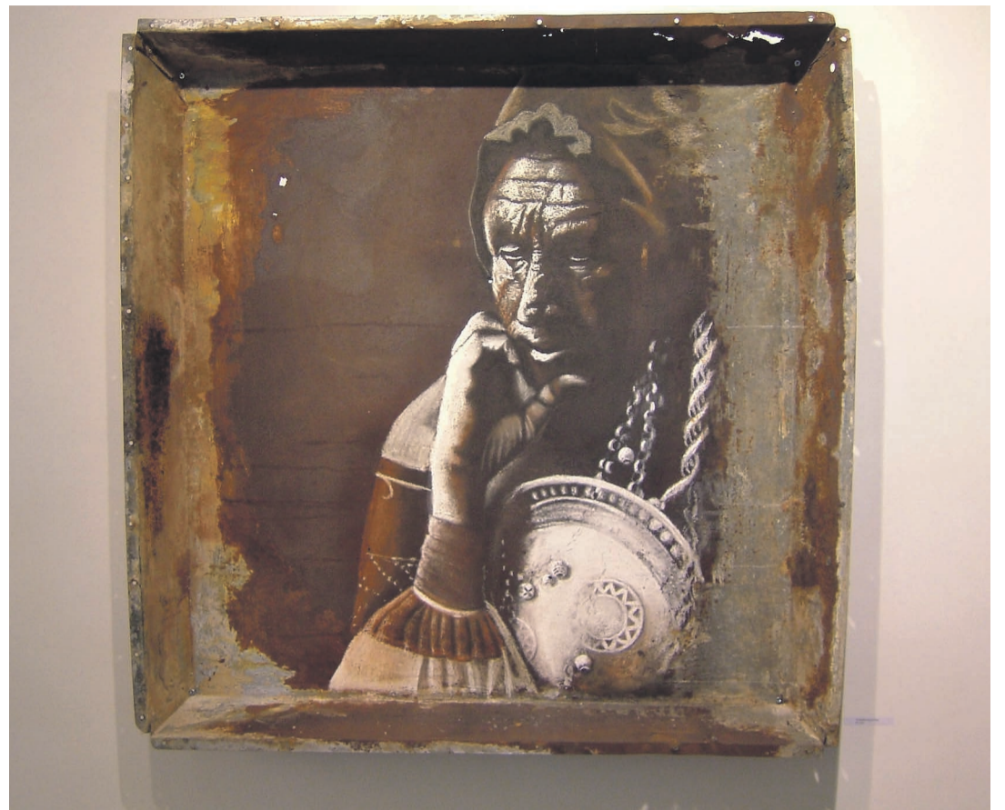
Taarka pleki pääl.

Oll õks tä naane laulinõ, imekene oll ilolinõ, jäti õks tä laulu mee- laul- ta', ilosõna' mee- le iski'.