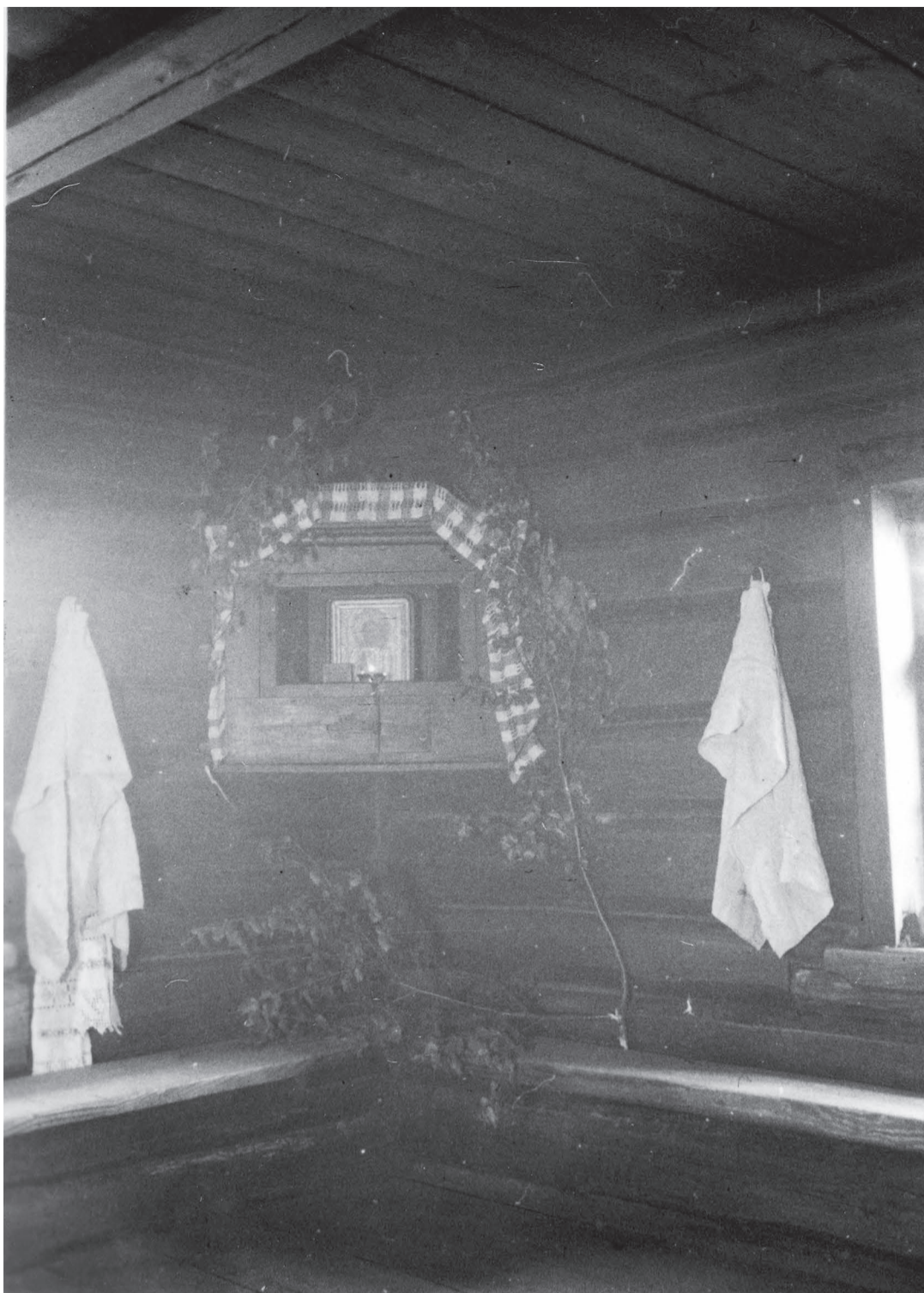
Simaski talo pühãsenulk kivodaga.

Kivoda' olli' inãmbüiste kuusõlavvost, iispuult laemba', takast kitsamba', iih raami seeh kats põõrãkõisi vai haagikõisiga kinni pantavat klaasist ussõkõist hingi pããl. Vahel oll' kapi lae vai edeliistu pããle lõigat määnegi aastaarv vai mito. Kintõsõst oll' ülevãh sepãtõünã painutõt tsãnk vai oherdõt kats mulku, minkist paklanõ kabõl lãbi aeti. Kapp võid-