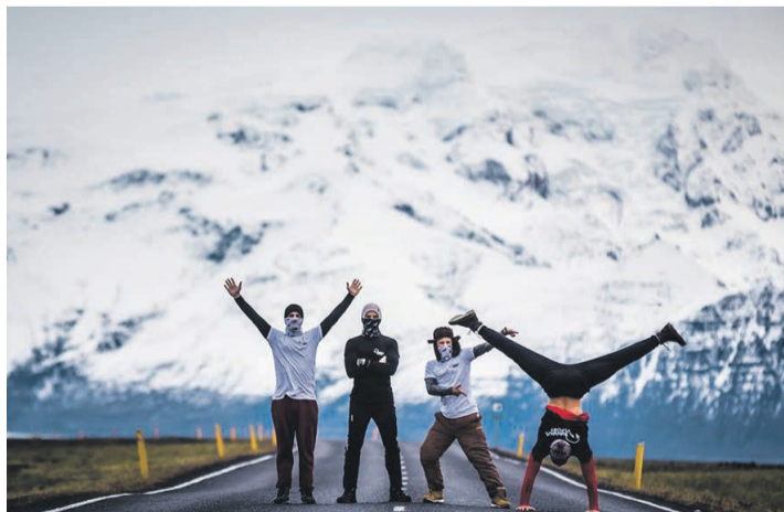
MTÜ Vabadussport liikmõ.