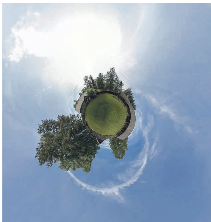
Maailma veere pääl.

Minkaga' mi kamanda? Mõnõki' mõttõ, mia' omma' talvõnõst heränenü', nakasõ' vormi võtma silmäilos külälisi jaos. Õgah muusiumih nakas olõma ütõ seto kultuuri ise-loomustav teema ja ku nuu' teema' kokko panõ, sis mi saa hüä ülekaehusõ seto kultuuri. Mi taha külälisõlõ pakku' õgah muusiumih huvtavva ja