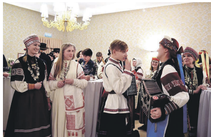
Konsuli vastavõtul Pihkvah. Noorõ pillimänguh ja iloh.