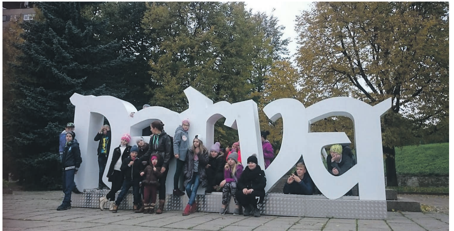
Meremäe noored käisid külas oma partneritel Narvas.