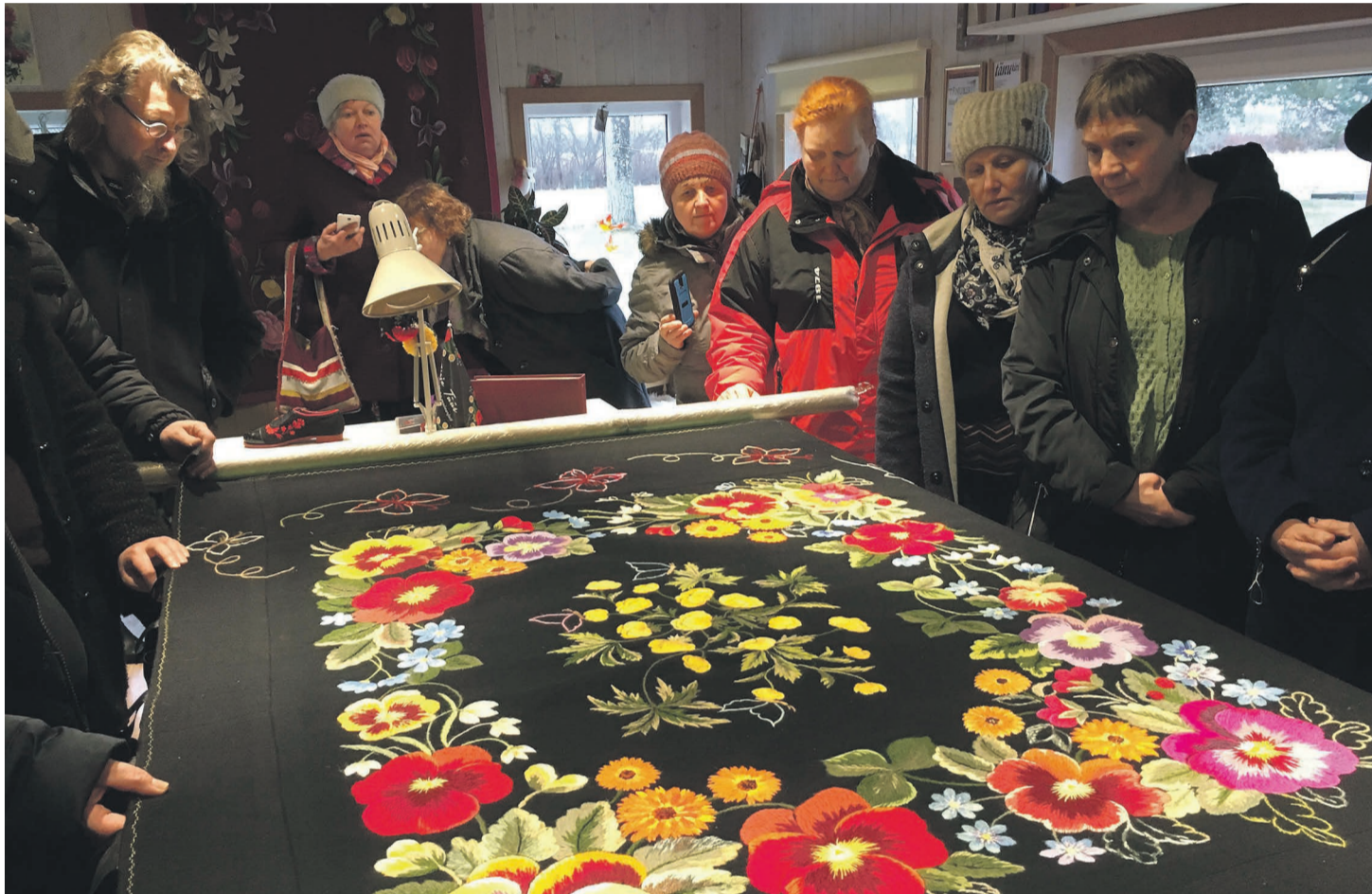
Muhu tekki imetlemäh.

Puulpühä vei reis meid Muhu Puidukotta. Vanah mahlatüüstüseh ja veinivillm- sõ huunõh ol' puhas apar puu- tüümassinidõga tüüstüs. Lihv-