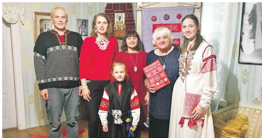
Õnnitlõsõ' latsõ' ja latsõlatsõ' perridega.