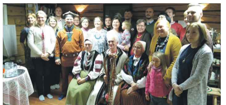
“Kiili küük” osavõtja.

Uma kodokeeleh kõnõlõminõ olõ-õi inäp õgäpääväne, nii ku prosta kodosõõgi süüminõgi' om vaeldõd vööridõ söögikraamõ vasta, nii ka' kiil. Kokkotulnu' rahva' seledi', midä nä omma' tennü', kuvvamuudu läbi uma söõgitegemisõ oppusõ opanu' kiilt. Tõõsõl pääväl