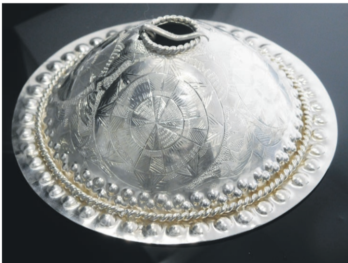
Sõlg. Valmistaja Riitsaarõ Evar.