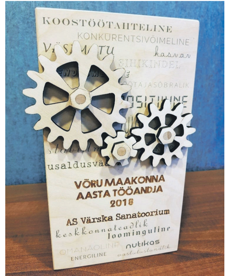
Võru maakonna aasta tööandja 2018 auhind.

Kaasaegne kuurortravi, mida Väraska kuurortravikeskus osutab, on suunatud tervise säilitamisele ja haiguste ennetamisele. Erinevad pakettid on välja töötatud meie pikaajalisele ko-