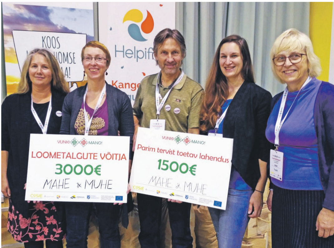
Mahe ja Muhe.