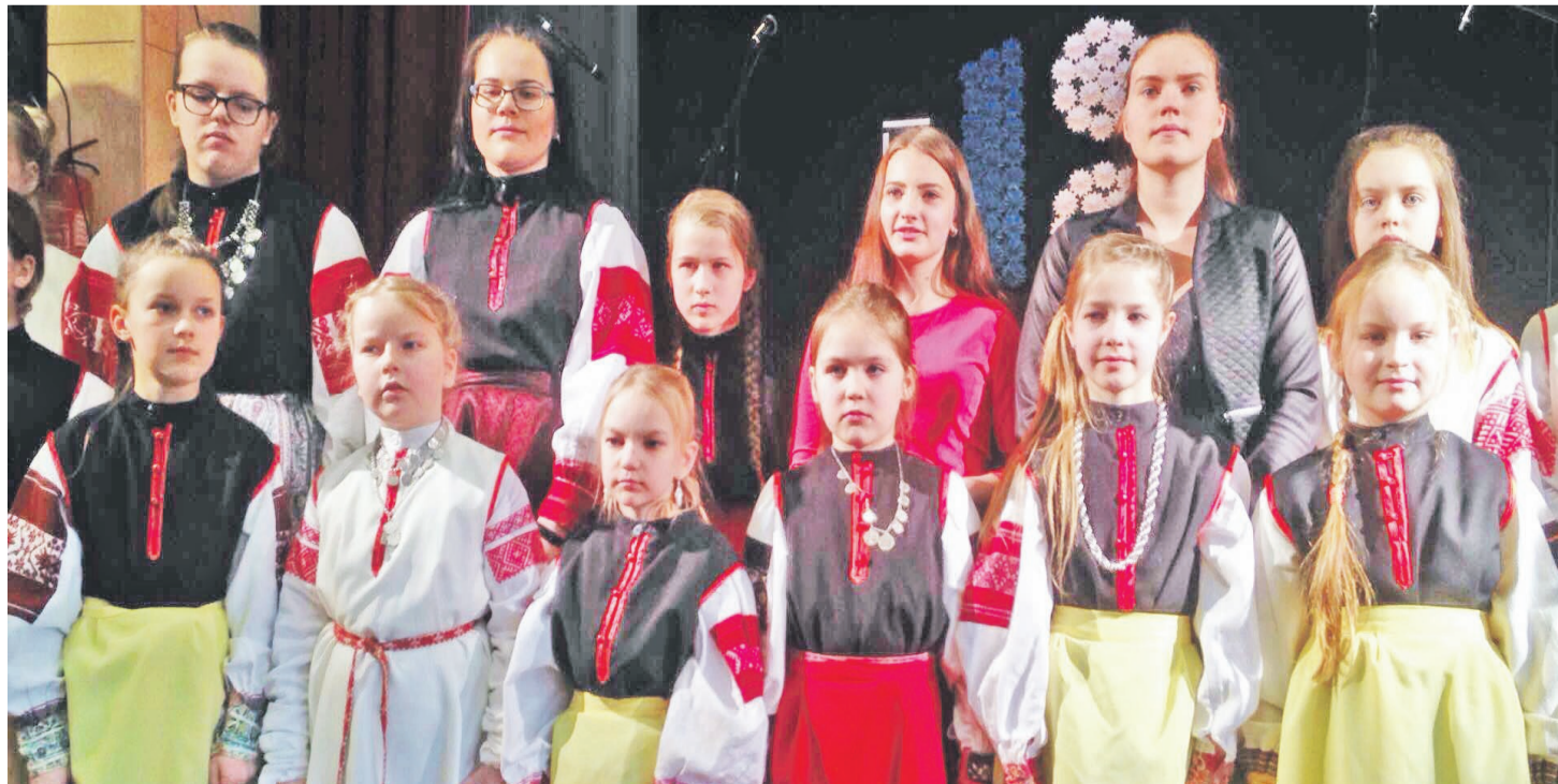
Verska latsõ seto nädälil laulmah.