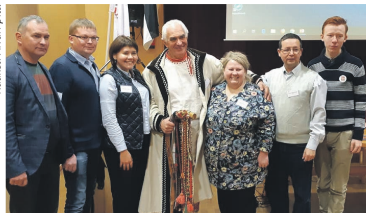
Ülemsootska hõimurahvidega kuutüüd tegemäh..

misõlõ ja arõnda' riikevahõlilic kultuurisuhtit' ja -diplomaatit. Järgmõtõl aastagal om rahvusvahelinõ põlisrahvidõ kiili aastak ja tuu avitas kindlahe soomõ-ugri rahvidõ kiili ja kultuuri laebalt tutvusta',” kõnõl Saar.