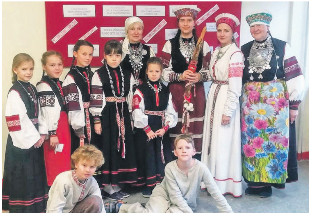
Seto nädal Väraska Gümnaasiumis.

Väraska Gümnaasiumi 6. klassi võistkond osales külalisvõist-