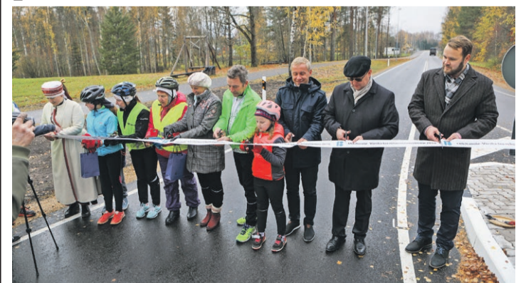
25. oktoobril kogunes rahvas Mikitamäe-Väraska teelõigu pidulikule avamisele. Rattaga startis Mikitamäelt ja Värskast avamisele kokku paarkümmend inimest. Kohal olid ka Maanteeameti esindaja, projekterija, ehitaja ja järelvalve esindaja. Kõik said osa ka kontserdist ja peolauast.