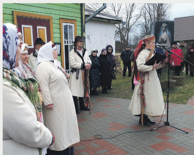
Nursootska pidä kõnõht.