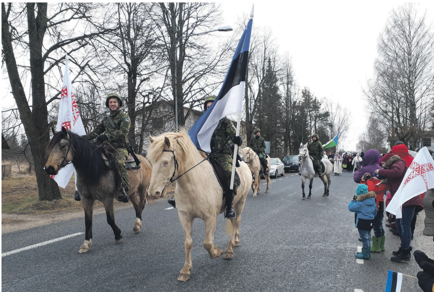
Seto ratsavägi Obinitsa paraadil kõgõ iih.