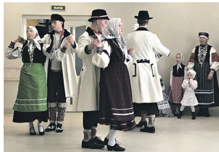
„Hiifo“ Petsereh laulu- ja tandsopundilt Modus. Eräkõgo pilt

Kündlekuu 27. päävä hummogu kell säidse istõ katsõist tandsopundi Modus inemist, Vinne viisa' karmanih, katõ massina pääle ja alosti' tiid Koidula piiripunkti poolõ. „Ankõ' tiidä', ku kavvõndah