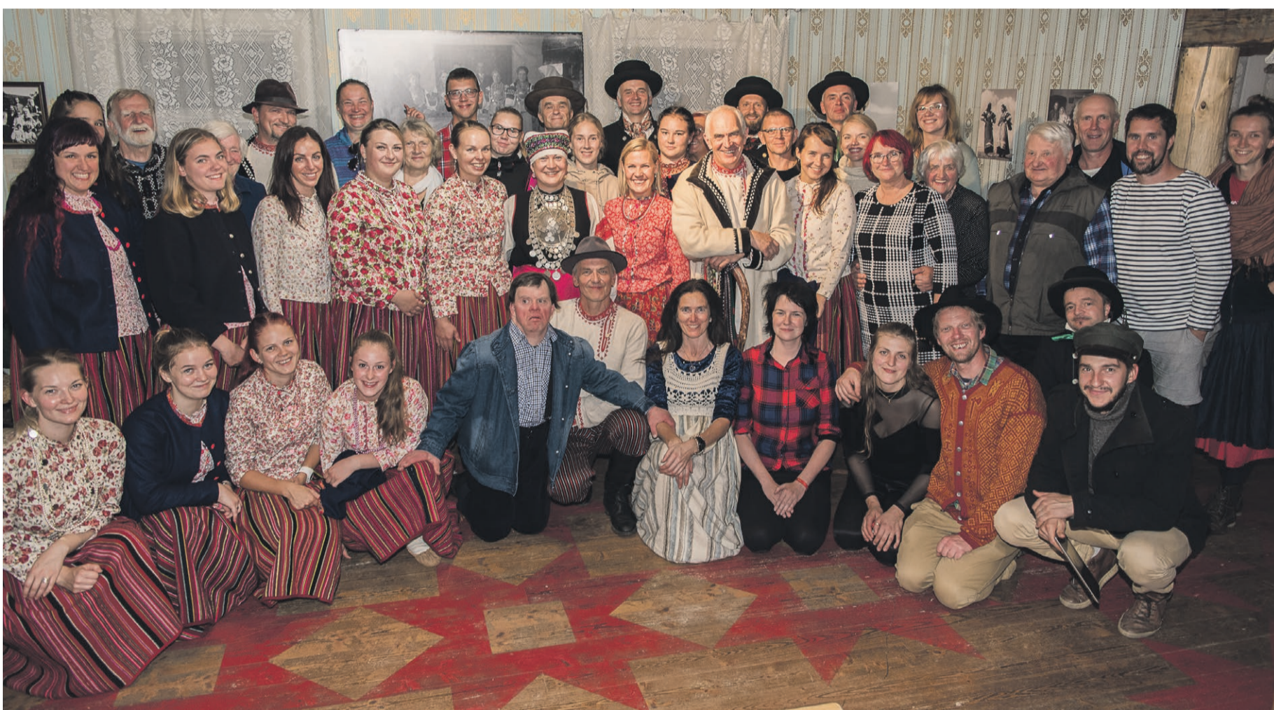
Seto-kihnu-suiti-liivi pido Obinitsah.

Vai mine' tiiä' – Aare jo inämbüste seto rõvit kandki ja seto kiilt kõnõlõs, ku õi olõ' käsil kaitsõliit vai EV aastapäävä aktus.