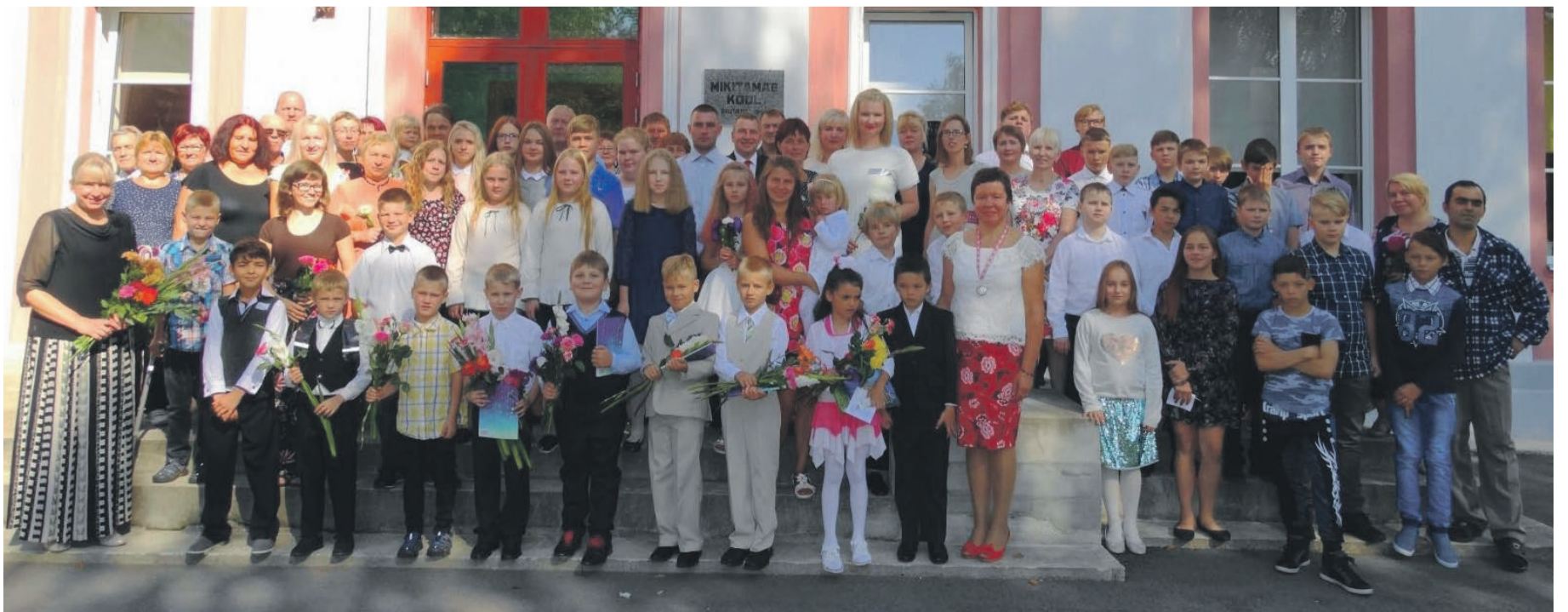
Mikitamäe koolipere koos vanemate ja külalistega 3.septembril.