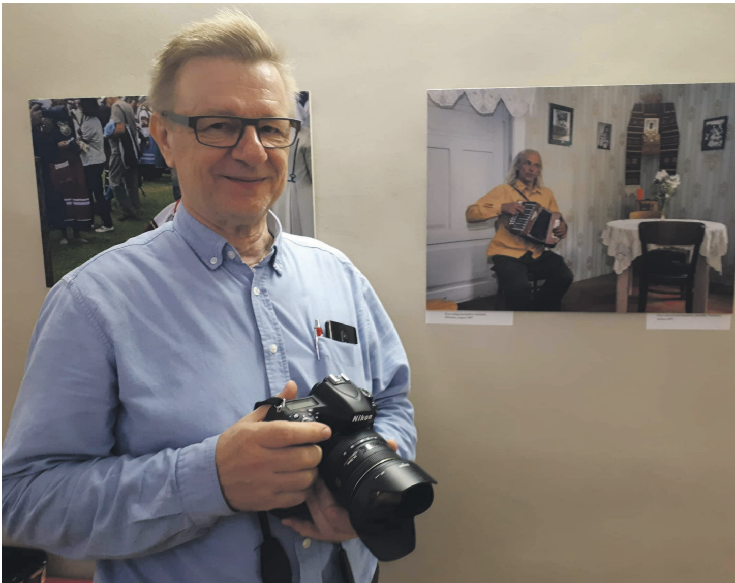
Sundelli Harri näütuse avamisõl Talinah.