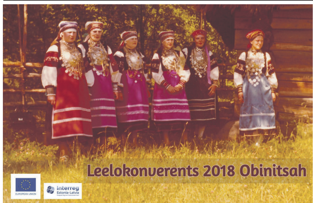
Leelokõnverents 2018 Obinitsah

„Jaapanlasõ' tulõva!“ hõikas kiäki. Riiüpä kohvitassi lõpuni. Ülembsootska hiit laja säläga särgi sälgä, võtt sootska-kepi peio ni om valmis külälisi tulõkis. Mina aga rutta tuulõvihini ja rändlinnustiibu kohina all kodo ülembsootska juttu üles tähendämä, õt kõik lehelu-gõja' tuust osa saasi'.