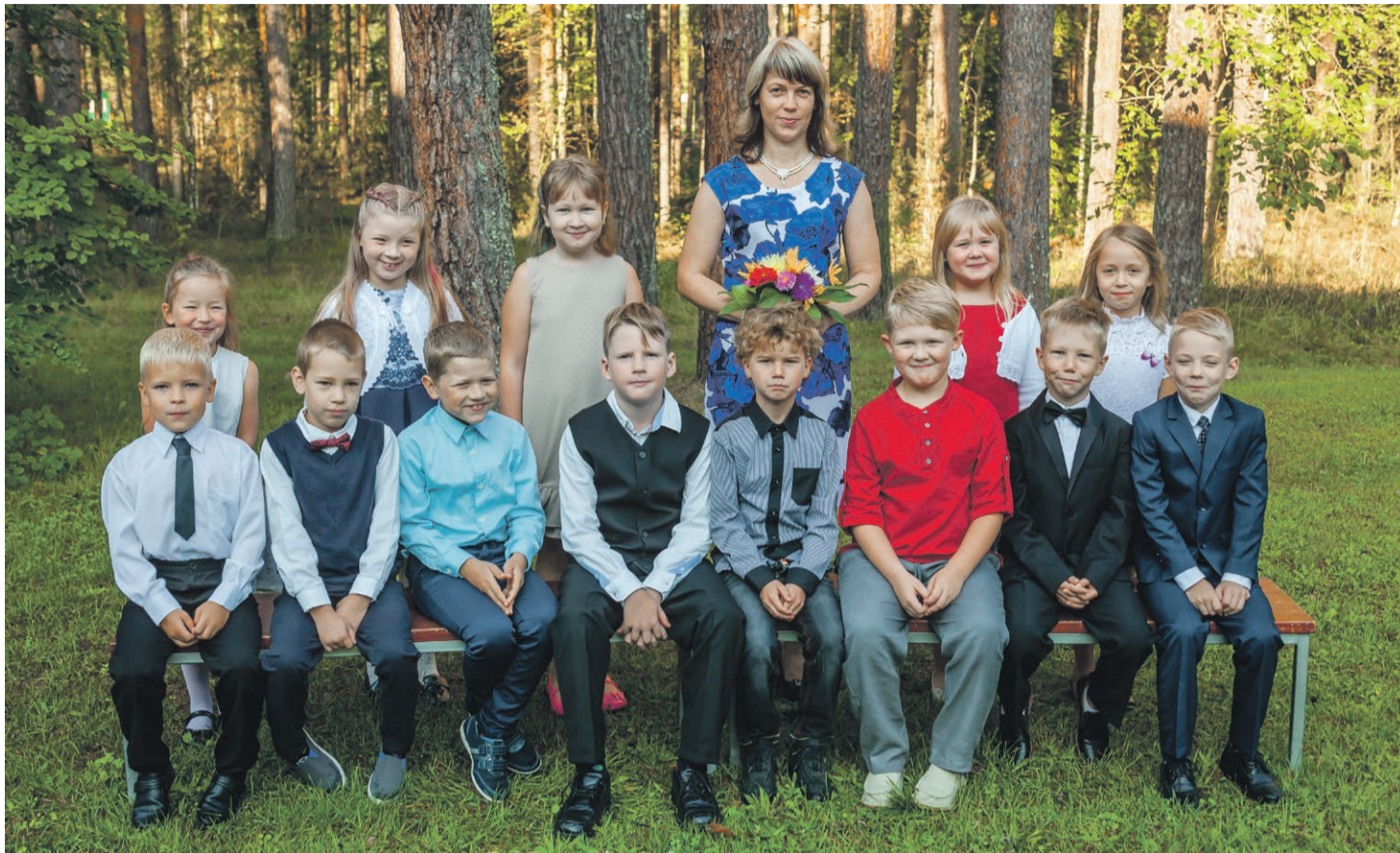
Värska kooli 1. klass.