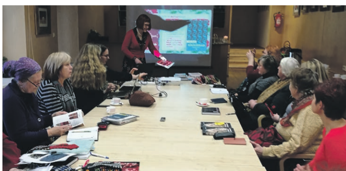
Rahvarõivaraamatu teemapäeval teevad koostööd teadlased ja käsitöölised.

Info taotlemise ja nõustamise kohta www.piiriveere.ee .