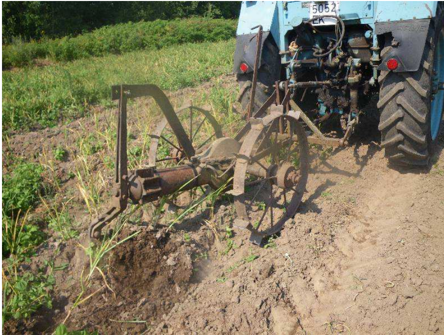
Pilt 10. Küüslaugu saagikoristamisel on heaks abivahendiks vaokergitaja. Saab kasutada ka kartuli rootorvõtumasinat, aga rootori labad tuleb enne ära võtta

Küüslauku koristatakse kas käsitsi või suuremate tootmispindade korral masinaga. Masinatest on Eestis kasutatud kartuliraputit või sibulakoristustehnikat. Ka juurviljade vaokergitajat saab edukalt kasutada, millega kergitatakse küüslaugu vagu pehmeks ning seejärel tõmmatakse küüslauk käsitsi pinnasest välja. Sobivate ilmastikuolude korral võib küüslaugud peale mullast kergitamist jätta paariks päevaks põllule kuivama, samas aga võib ere päike põhjustada liitsibulal päikesepõletusi ja väga kiire kuivamise korral rebenevad kattesoomused.