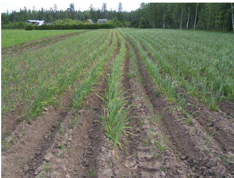
Pilt 6. Küüslaugupõld 70 cm reavahega

Küüslauguküünte istutusel võib kasutada erinevaid skeeme. Istutustihedus sõltub mahapandavate küünte suurusest ja mõjutab kasvavate küüslaukude suurust. Sügisel istutatakse tütarsibulad 5–6 cm, kevadel 2–3 cm sügavusele. Suuremad küüned pannakse maha vahekaugusega 8–12 cm, väiksemad 5–7 cm. Kui kasutada tihedamat istutust, kasvavad väiksemad küüslaugud. Väiksemapinnalisel kasvatamisel võib küüslaugud istutada 3–5 realisse peenrasse, jättes ridade vaheks 15–25 cm ja taimede vaheks reas suviküüslaugul 6–10 cm, taliküüslaugul 10–15 cm. Küüslaugu küüned vajutatakse mulda teravikuga ülespoole, kuigi küüslaugu idu kasvab valguse poole ka siis, kui küüs pannakse mulda terav ots allapoole või küljeli, ent sellisel juhul kasvavad kõverad taimed. Peenras kasvatamine suuremal pinnal on tülilikam eelkõige raskendatud umbrohutõrje tõttu.