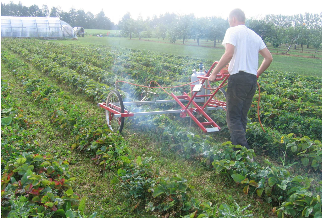
Pilt 18. Leegitamisega lehtede eemaldamine pärast saagikoristust

Teiste multside puhul (näiteks puulaastud) võib kasutada ka masinaga leegitamist. Masina eeliseks on ka see, et põletamine ei sõltu ilmast ja lehtede kuumutamisel ei eraldu nii palju suitsu.