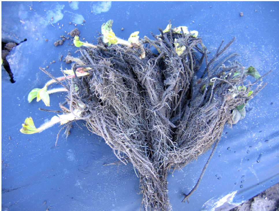
Pilt 16. Frigotaimed

Kolmandaks paljundusmeetodiks on koekultuurist paljundamine (meristeemtaimed). Sel teel saadud taimed on haigus- ja kahjurivabad. Meristeemtaimi kasutatakse ainult omale taimede paljundamisel uute, veel vähelevinud sortide puhul. Istandikke nende taimedega ei rajata.