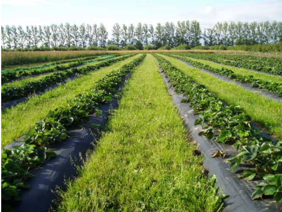
Pilt 15. Kilemultsiga istandik

Väetamisel arvestatakse, et ei kaasneks keskkonna reostuse suurenemist. Tuleb takistada toiteelementide kadu mullast väljauhtumise teel. Seega loodushoiu seisukohalt on kasulik kilemultši kasutamine, mis võimaldab kasutada varuväetise norme. Multšita istanduses ei ole soovitatav eelnimetatud põhjustel varuväetamine. Tuleb ka meeles pidada, et: