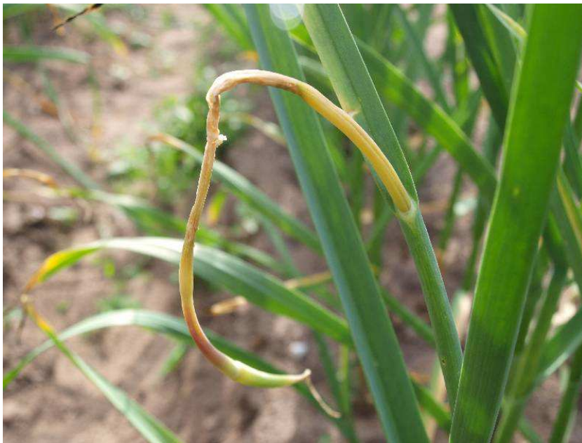
Pilt 9. Sibulakoi kahjustus ilmneb tihti õisikuvarrel

Sibulakoi kahjustus ilmneb umbes samal ajal kui õisikuvars kasvab taimest välja. Tihti ongi kahjustunud õisikuvarre ülemine osa, mille sees koi röövik toitub. Sel juhul tuleks kahjustatud õisikuvarred kokku korjata ning hävitada. Kahjureid on põhimõtteliselt võimalik tõrjuda ka koirohu-, paiselehe- või võililleleotisega pritsides, kuid seda tuleks teha kahjurputukate lendluse ajal vähemalt kord nädalas pritsides. Nende preparaatide kasutamisel eksitatakse kahjureid võõra kultuuri lõhnaga ning nad ei leia küüslaugutaimet nii kergesti üles.