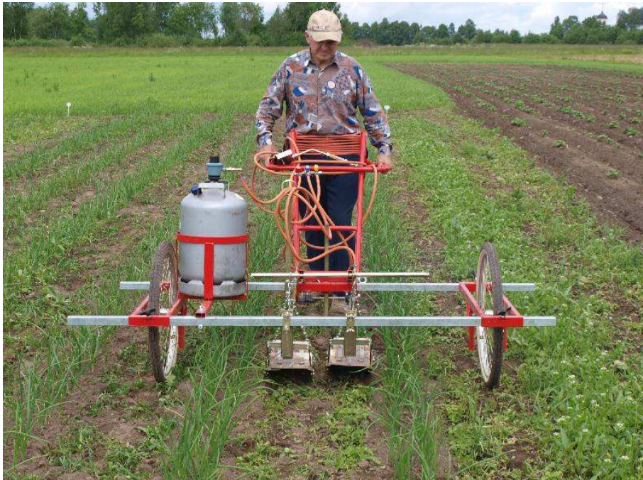
Pilt 2. Soome firma Elomestari lükatav leegitaja väiksemapinnalisele tootmisele

mullaharimist. Vahetult enne porganditaimede tärkamist on võimalik leegitada kogu põlluala ja hävitada kõik tärganud lühiealised umbrohud. Leegitamisel kulgeb propaangaasi leek kiirusega 2–8 km/h üle umbrohutaimede ning taime rakud hävivad kõrge temperatuuri tõttu (60–70°C) ja taim kuivab mõne päevaga. Parima tulemuse annab leegitus siis, kui umbrohud on väikesed, 5–10 cm kõrgused. Üheidulehelised umbrohud on leegitusele vastupidavamad kui kaheidulehelised. Samuti on leegitamine väheefektiivne mitmeaastaste umbrohtude tõrjel. Üsna vastupidavad on ka nt harilik hiirekõrv, lõosilm, murunurmikas, kannike, tatrad ja lõhnav kummel. Suhteliselt kergesti on võimalik tõrjuda nt hanemaltsa, raudnõgest, ristirohtu ja vesiheina. Kuumus ei kahjusta taime maa-aluseid osi ning mullas leiduvaid organisme.