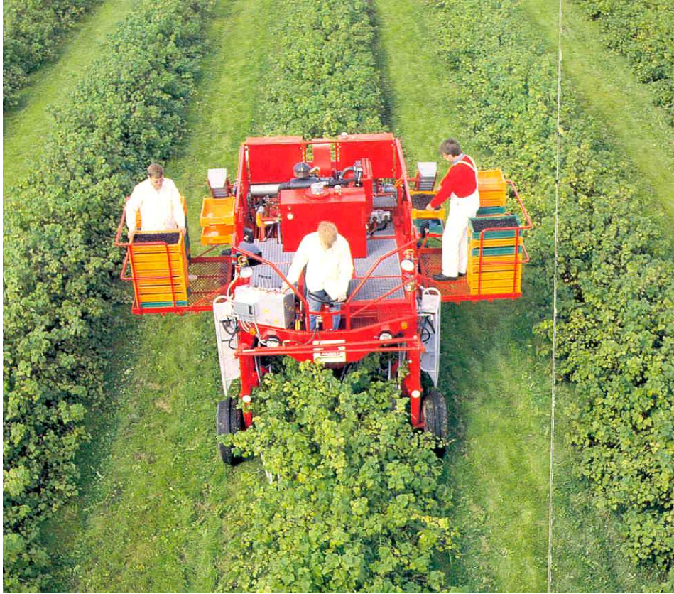
Pilt 24. Musta sõstra korjamine kombainiga