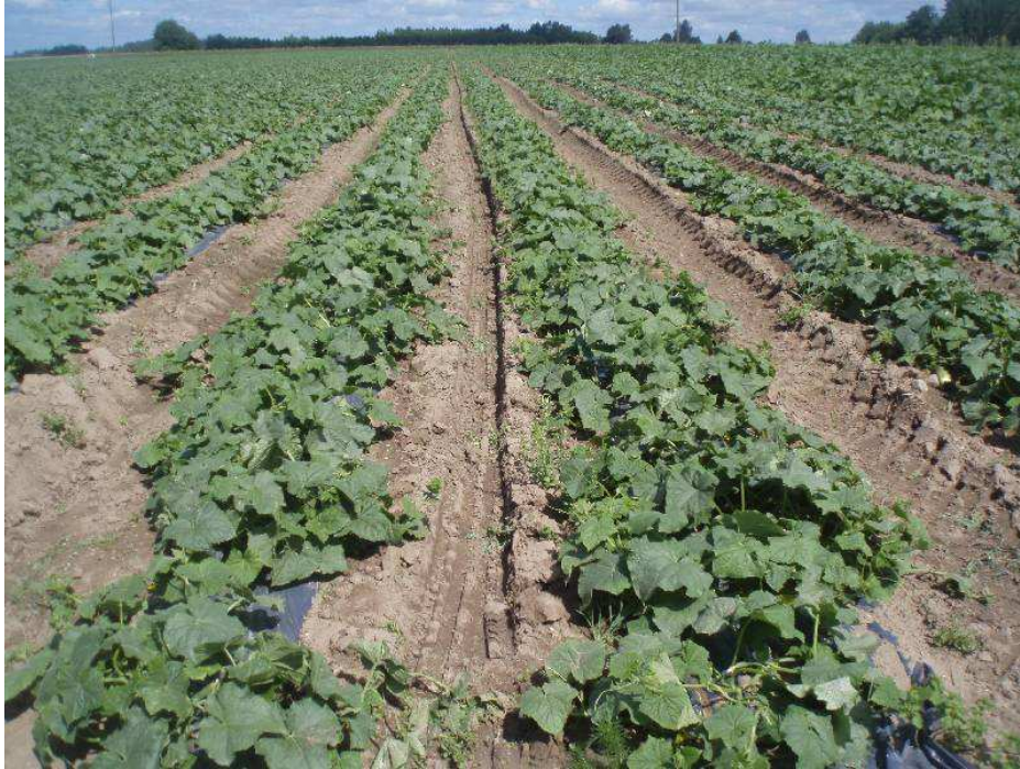
Pilt 13. Kurgipõld esimeste saagikorjete aegu. Taimed on täies kasvujõus, kuid reavahed ei ole veel täielikult kokku kasvanud