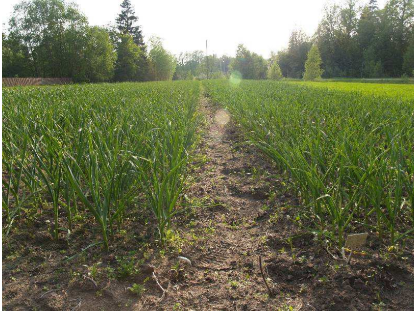
Pilt 5. Käsitsi maha pandus küüslauk peenras

Küüslauguküünte istutusel võib kasutada erinevaid skeeme. Istutustihedus sõltub mahapandavate küünte suurusest ja mõjutab kasvavate küüslaukude suurust. Sügisel istutatakse tütarsibulad 5–6 cm, kevadel 2–3 cm sügavusele. Suuremad küüned pannakse maha vahekaugusega 8–12 cm, väiksemad 5–7 cm. Kui kasutada tihedamat istutust, kasvavad väiksemad küüslaugud. Väiksemapinnalisel kasvatamisel võib küüslaugud istutada 3–5 realisse peenrasse, jättes ridade vaheks 15–25 cm ja taimede vaheks reas suviküüslaugul 6–10 cm, taliküüslaugul 10–15 cm. Küüslaugu küüned vajutatakse mulda teravikuga ülespoole, kuigi küüslaugu idu kasvab valguse poole ka siis, kui küüs pannakse mulda terav ots allapoole või küljeli, ent sellisel juhul kasvavad kõverad taimed. Peenras kasvatamine suuremal pinnal on tülilikam eelkõige raskendatud umbrohutõrje tõttu.