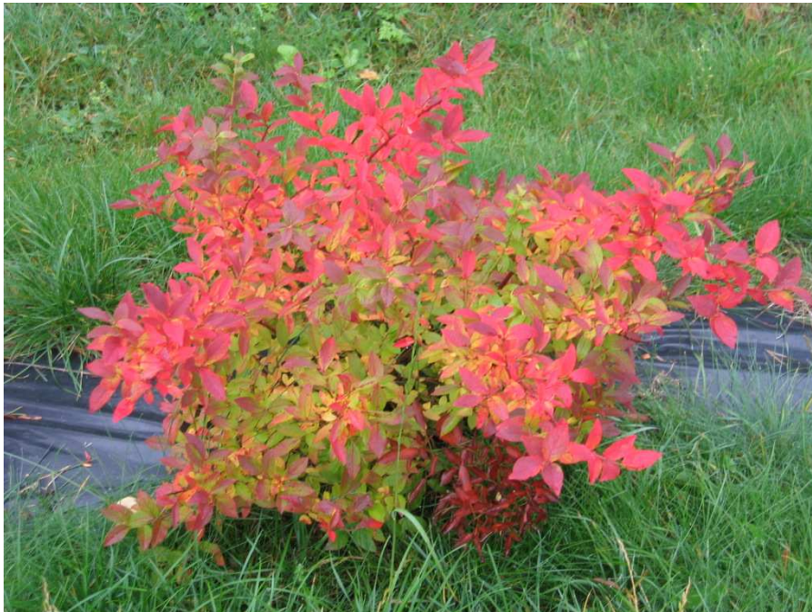
Pilt 22. Mustikapõõsas sügisvärvides

agregaadiga saab koristada mustikaistandikku, kus regulaarselt taimi tagasi lõigatakse või põletatakse. Üle aasta tagasi lõigatud taimedel on vaid üheharulised harunemata oksad. Mitmeaastaste harunenud vartega taimi ei ole võimalik selle seadme abil koristada. Mehhaanilise koristuse edu tagab umbrohupuhas ja tasane mustikamaa.