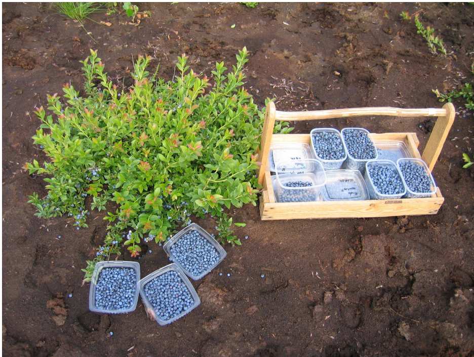
Pilt 21. Marjasaagi korjamine müügiks värske marjana

Marju saab koristada käsitsi, kusjuures võimalik on ka spetsiaalsete „marjakammide“ kasutamine. Üheks olulisemaks probleemiks on mehhaaniliste vigastuste vältimine marjade koristamisel. Ülevalminud marjad on pehmemad ja seepärast esineb nende koristamisel rohkem vigastusi. Saak on soovitatav korjata vara hommikul, kui on veel jahedam, sest siis säilivad marjad paremini ja on ka raskemad. Palava ilmaga saagikoristuse puhul on marjad kuumenenud, muutunud pehmemaks ja on kergesti vigastatavad. Võimaluse korral korjatakse marju hommikul või õhtupoolikul, vältida tuleb marjade korjamist keskpäeval, kui õhutemperatuur on kõrgem. Samas koristatavad marjad peavad olema kuivad, et vältida vahakirme kadumist viljadelt ja seeläbi kiiremat riknemist.