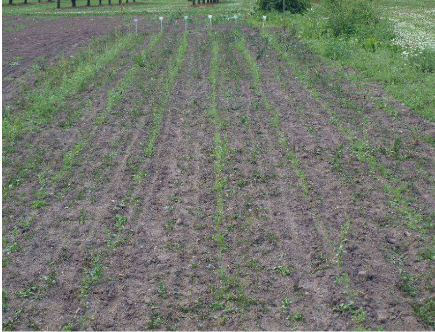
Pilt 3. Porgandipõld teisel päeval pärast reavahede leegitamist. Vasakul viimane rida leegitamata