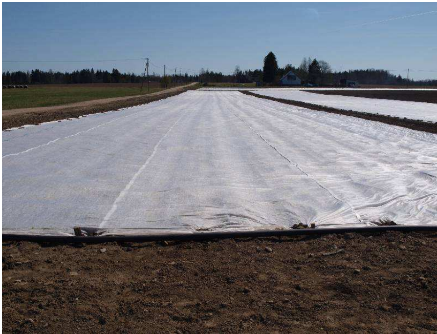
Pilt 1. Külvijärgne kattelooriga katmine kiirendab porgandi tärkamist ning aitab vältida porgandi-lehekirbu ja porgandikärbse kahjustust

Olenevalt aastast ja kasvukohast võib see toimuda aprilli II poolest alates. Varajase porgandi külvid tasuks tärkamise ja taimede algarengu kiirendamiseks katta katteloori või putukakaitsekangaga (aitab ka porgandi-lehekirbu ja porgandikärbse kahjustust vältida). Enamasti külvatakse meil porgandit mai I või II dekaadil või juuni alguses. Külviaja valikut mõjutab ka mulla niiskusesisaldus. Et mai lõpu poole on enamasti vähem sademeid, siis võib hilisem külv niiskusepuudusel ebaühtlaselt tärgata või halvimal juhul sootuks hävida. Nii mõnelgi porgandikasvatajal on tulnud teha korduskülv niiskusepuudusest kahjustatud põldudel. Porgandit on võimalik külvata kuni juuni lõpuni.