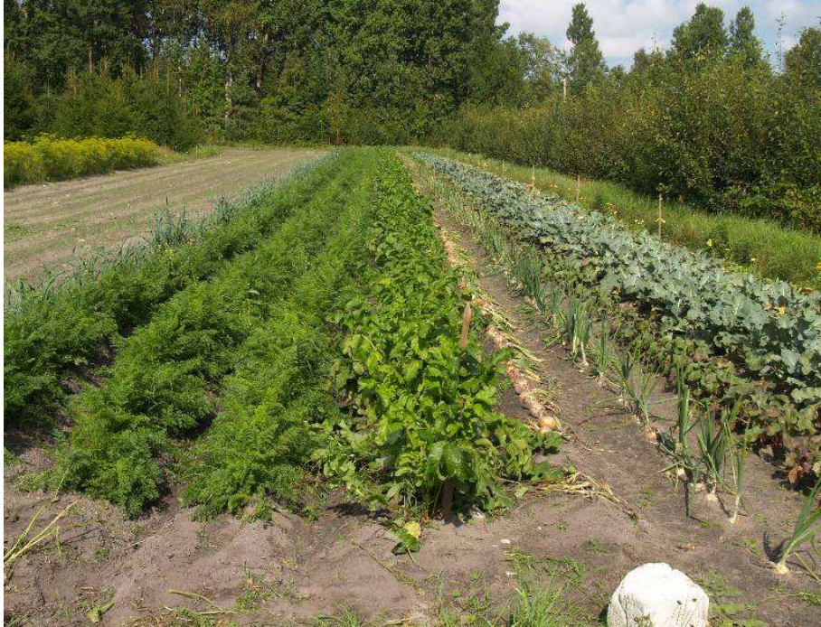
Pilt 4. Segaviljelus aitab vähendada kahjurite kahjustust

võtetele: viljavaheldus, hea põlluhügieen ja taimede piisav varustamine toitainete ja veega. Tõusmepõletike ja juuremädanike tõrjeks on lubatud maheseemnete puhtimine bakterpreparaadiga Mycostop ning erinevate Trichoderma harzianum baasil tehtud preparaatidega.