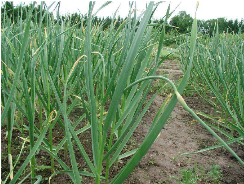
Pilt 8. Õisikuvarred tuleks eemaldada, et liitsibul kasvaks võimalikult suureks

Kui eesmärk on saada võimalikult suuri küüslaukusid, tuleb putkuvatel küüslaugusortidel õisikuvars pärast selle ilmumist ära murda. Kui õisikus hakkavad varresibulad arenema, hakkavad toitained nendesse kogunema ning mullas olev sibul jääb väikeseks. Seda saab teha kääridega lõigates või lihtsalt õisikunupu alt murdes. Kuna küüslaugutaimede mahl võib nahka söövitada, siis peaks selle töö tegemisel kandma kummikindaid. Murtud õisikuvarred võib jätta põllule või kokku korjata, kuna neid on võimalik marineerida.