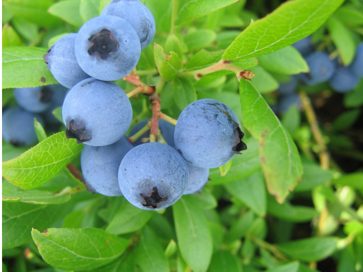
Pilt 19. Madala aedmustika marjad