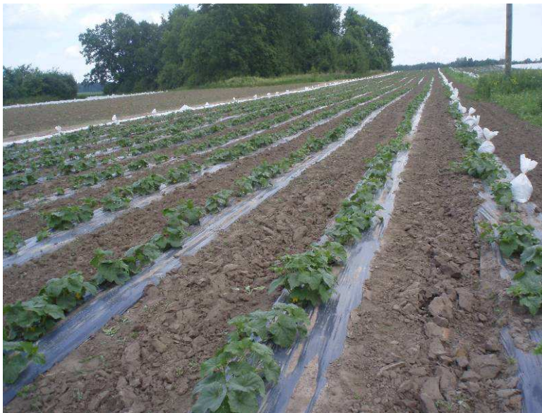
Pilt 12. Katteloor on hooldustöödeks kurgipõllult eemaldatud. Põllu servas on liivakotid katteloori kinnitamiseks

Kasvatustehnoloogias võib olla ka teine põhimõtteline erinevus. Osad tootjad kasvatavad taimed kasvuhoones ette, teised külvavad seemne otse kasvukohale. Seemnest otsekülv võimaldab kokku hoida taimede ettekasvatamisega seotud kuludelt (taimekassetid, kasvusubstraat, jms), kuid saagikande periood algab veidi hiljem ning see ei sobi ka igas kasvukohas.