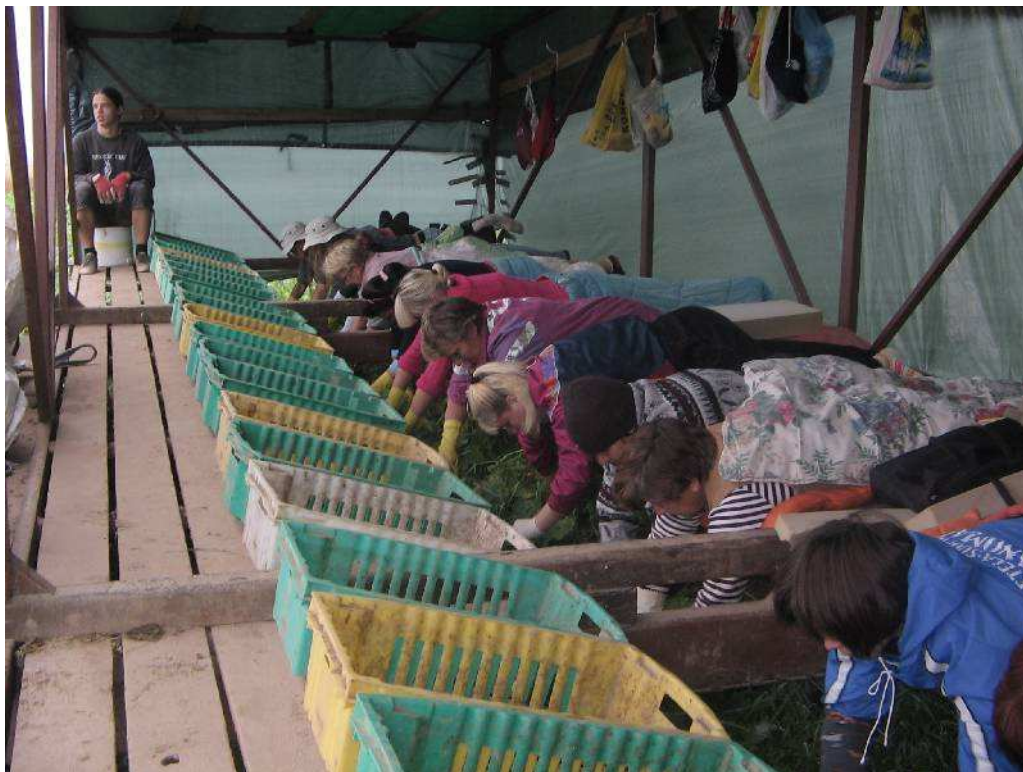
Pilt 14. Kurgi korjamine kurgikorjamislavaticaga

Saagikoristus on kurgikasvatuse juures kõige töömahukam osa, nõudes 80% kogu tööjõuvajadusest. Saak koristatakse käsitsi ja keskmiselt korjab inimene tunnis 17-25 kg. Suurte pindade koristamiseks on appi võetud nn kurgi koristusplatvormid, mille abil saavutatakse kuni 30% kõrgem tööjõudlus. Selleks kasutatakse tihti tootjate endi poolt ehitatud, traktori taha haagitavaid 6...7 meetri laiuste "tiibadega" järelveetavaid platvorme, millel töölised kõhuli lebades kurke koristavad. Koristusplatvormi töökiiruseks on umbes 100-250 meetrit tunnis.