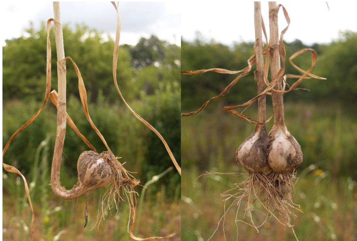
Pilt 11. Vead mahapanekul: Küüne tipp on sattunud allapoole. Näiliselt ühe küüne sees on tegelikult kaks kasvupunga

Taliküüslauk ei säili kuigi hästi. Küüslaugu pikemaajalisel säilitamisel on kõige olulisem tagada optimaalne säilitusrežiim: säilitatakse kuivas ning pimedas ruumis temperatuuril -2 ...+2 °C ja 65...75 % õhuniiskuse juures. Sellistes tingimustes säilib küüslauk minimaalsete kadudega 6-7 kuud. Üle 75 % õhuniiskus ja kõrgem temperatuur hoiuruumis põhjustavad küüslaugu kasvama minekut paari kuu vältel.