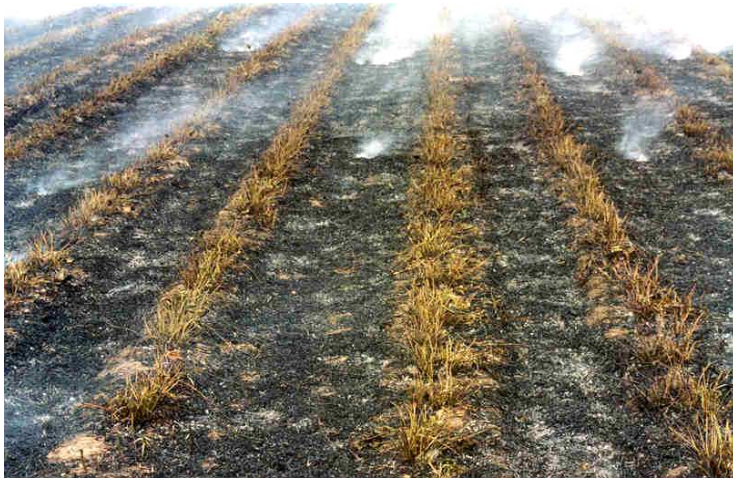
Pilt 17. Põletatud istandik

Teiste multside puhul (näiteks puulaastud) võib kasutada ka masinaga leegitamist. Masina eeliseks on ka see, et põletamine ei sõltu ilmast ja lehtede kuumutamisel ei eraldu nii palju suitsu.