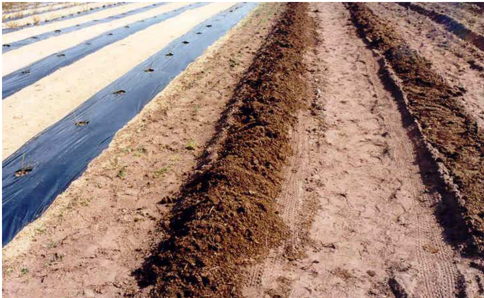
Pilt 20. Istandiku rajamine kilemultsiga, kus on kasutatud mullaparanamiseks turvast

Sünteetilisest multšidest on enam tuntud must kile. Võrreldes kilega on sünteetilisest multšidest tugevam ja vastupidavam peenravaip, mis on vastupidav ultraviolettkiirgusele, tihe ja vett läbilaskev polüpropüleenkangas. Peenravaiba vastupidavus on 8-10 aastat. Sobilik on veel tekstiilmultši, mis on mõneti sarnane peenravaibale, kuid selle vastupidavuseks loetakse 5-6 aastat. Tekstiilmultši kare pind takistab tigude ja nälkjate tegutsemist taimede vahel.