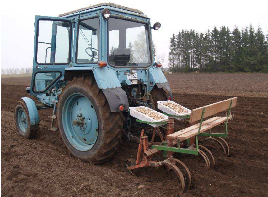
Pilt 7. Küüslaugu mahapanek kaherealise kartulipanekumasinaga (torusse mahapanekumasin)

Olenevalt küünte suurusest ja istutustihedusest kulub küüsi 600–1200 kg/ha. Kuigi küüslauk on suhteliselt külmakindel kultuur, võiks pärast sügisest istutamist peenra katta 3–5 cm paksuse turba, komposti, kõdusõnniku või õlekihiga, see aitab istutatud taimi kaitsta tugevate külmade eest lumeta talvede korral. Õlgedega katmine on siiski problemaatiline, kuna kevadel takistab see masinatega vaheltharimist. Korraliku lumikatte puhul ei ole küüslaugul talvitumisega probleeme.