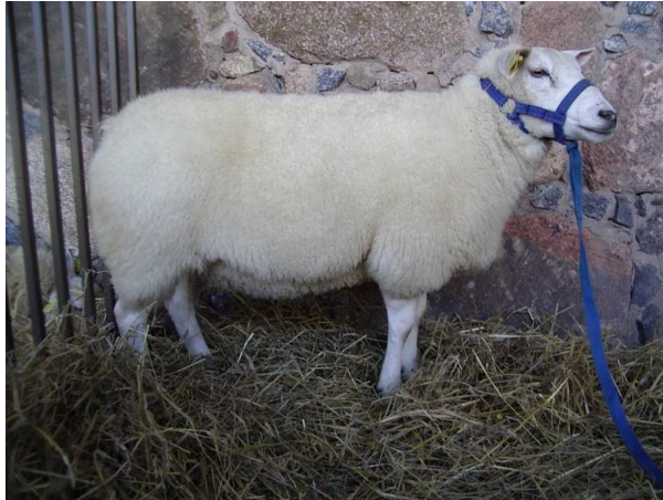
Pilt 2. Eesti valgepealine (P. Piirsalu)