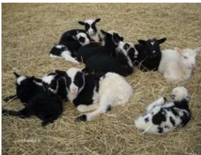
Pilt 15. Kevadised talled ( http://lambawark.wordpress.com/ )

Talvise poegimise eeliseks on see, et noorloomad saavad varem realiseerimisküpseteks ja eriti oluline on see tõuloomade müügi puhul, sest sageli soovitakse tõuloomi osta juba augustist alates. Talvise poegimise eelduseks on aga soojustatud lautade olemasolu. Talvise poegimise puuduseks on aga suurem jõusöötaid kulu ning suuremad kulud lautade ehitamisel, sest siis tuleb laudad ehitada soojapidavateks.