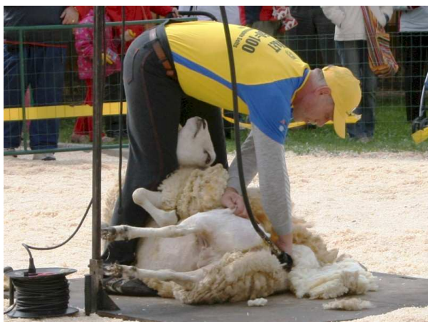
Pilt 9. Lamba pügamine (A. Tänavots)

Sügisene pügamine on otstarbekas korraldada vahetult peale lammaste lauta jätmist. Vahetult peale pügamist ei soovitata lambaid saata vihmase, tuulise ilmaga välja. Kui sel ajal on külmad ilmad, siis peaks lambaid peale pügamist hoidma 4-5 päeva laudas. Sügisel pügamisel soovitatakse kasutada pügamisteri, mis jätab lambale 0,5... 1 cm villa selga. Peale lammaste pügamist intensiivistub lammaste ainevahetus ja on teada, et lambad tarbivad pügamisjärgselt enam sööda kuivainet. Seepärast arvatakse, et tallede sünnimass on 10-15 % võrra kõrgem just pügatud lammastel. Samuti on teada, et ka söödakasutus on efektiivsem, sest toit on vatsas lühemat aega ja seetõttu proteiini lõhustub vatsas vähem, mis parandab söödakasutust. Ka on uttede söötmist kergem korraldada, sest pügatud lammastel on kergem toitumust hinnata. Nii on probleemseid lahjasid lambaid kergem karjast välja korjata. Pügatud lambaid mahub ka rohkem samasse sulgu ning loomad elavad vähem nn. kuumastressi kevad-talvisel perioodil kui väljas õhutemperatuur on hakanud kiiresti tõusma ja loomi hoitakse kinnises laudas.