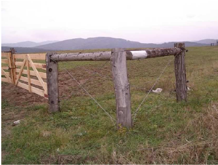
Pilt 12. Karjaaedade nurgad peavad olema kindlate konstruktsioonidega (P. Piirsalu)