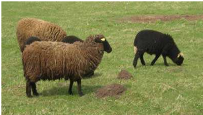
Pilt 3. Eesti maalamm (Eesti Maalamba Ühing)

Viimasel kümnendil on Eestis tekkinud soov kasvatada eesti maalambatüübilisi lambaid. 2003. aastal registreeriti Eesti Maalamba Ühing, kelle liikmete eesmärgiks on olnud eesti maalamba kui põlistõu ametlik tunnustamine. Tänapäevased seisukohad eesti maalammaste säilimise või kadumise kohta on vastakad isegi peale 2006.aastal tehtud „teadmata päritoluga“ lammaste geeniuuringuid. Uuringud on näidanud, et kultuurtõugudest geneetiliselt eristunud lammasteks võib pidada eelkõige Kihnu saare asurkonna lambaid. 2009.aastal on registreeritud A. Ä. Idvandi initsiatiivil Kihnu Maalammaste Kasvatajate Selts. Senini ei ole eesti maalammast ega kihnu maalammast eraldi tõuna tunnustatud.