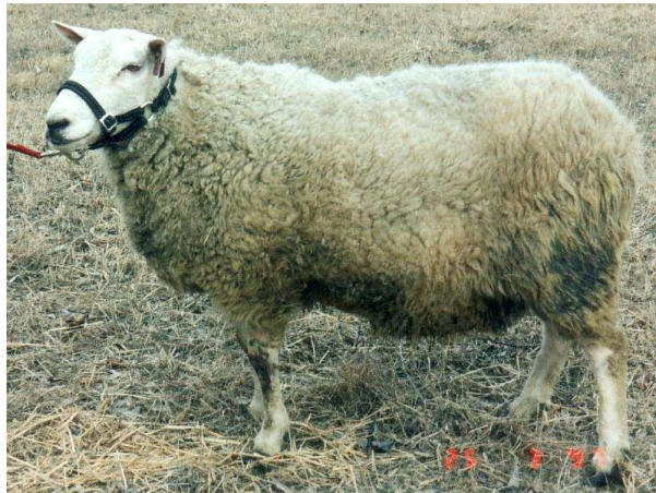
Pilt 8. Dala