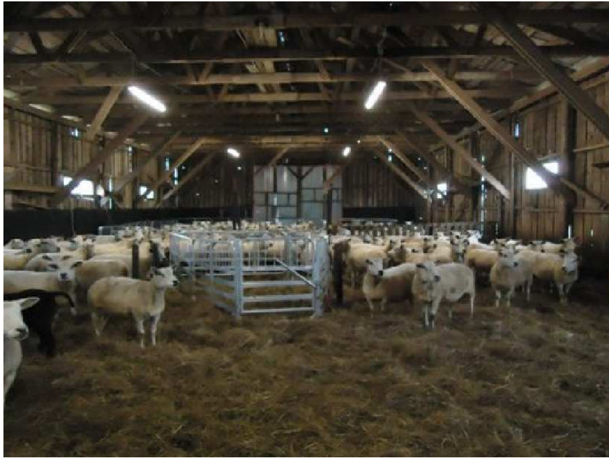
Pilt 14. Kaasaegne laut (keskel on lammaste sortimisaed) (P. Piirsalu)