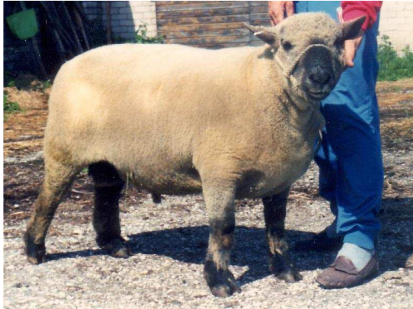
Pilt 5. Oksforddaun ( Oxford Down ) (P. Piirsalu)

tumedapealistel jäärtalledel 5,7 mm. Taanist ostetud oksforddauni jäärade negatiivseks küljeks tuleb pidada suhteliselt jämedat villa (38 \mu\text{m} ) ja tumedate villakarvade esinemist järglaste villakus. Mõnele aretajatele ei meeldi see, et oksforddauni lammastel on pea ja jalad villaga kaetud, mistõttu nende pügamiseks kulub veidi enam aega.