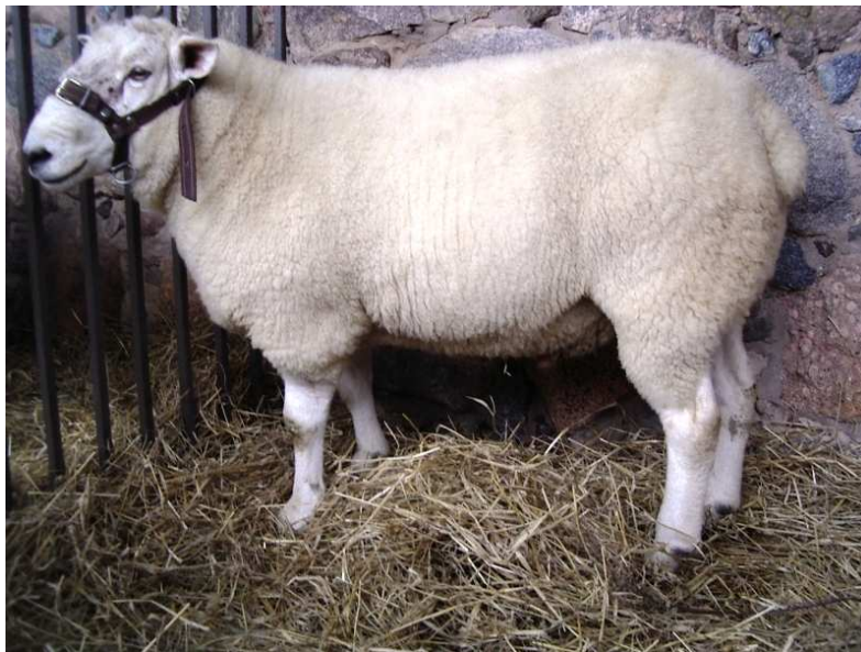
Pilt 6. Teksel

Eestisse imporditud tekseli jäärased on intensiivselt kasutatud eesti valgepealiste lammaste tõufarmides alates 1993. aastast, kusjuures tulemustega võib igati rahule jääda. Tekseli jäärad annavad järglastele hästi edasi ilusaid lihavorme. Tekseli ristandtalled tunneb ilma suurema vaevata ära nende täidlaste kintsude ja ümarate kehavormide poolest. Nad on silma paistnud rahuldava kasvukiiruse ja kvaliteetse liha poolest (lihakehade lihastus vähemalt R, tailiha osakaal suur, rasva osakaal väike). Ka villa kvaliteet on olnud hea, sest ristandtalledel on normaalse säbarusega, valge või helekreemika rasuhigiga vill. Villa peenus imporditud jääradel on keskmiselt 33 µm (50 Bradfordi kvaliteeti). Raskete poegimiste arv eesti valgepealiste lammaste farmides ei ole tekseli jäärade kasutamisega märgatavalt tõusnud. Alates 2001. a kasvatatakse ka Eestis tekseli tõugu puhasaretuse teel. Loodud on 4 tekseli aretuskarja. Tekseli lambaid on Eestisse toodud põhiliselt Taanist, s.o 2000. a 7 jäära, 2001. a 4 jäära ja 19 utte ning 2002. a 4 jäära ja 47 utte.