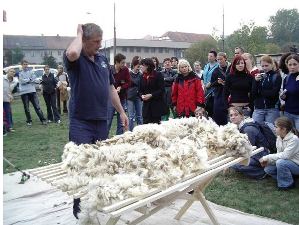
Pilt 10. Sortimislauad villakuga (P. Piirsalu)

Lambavilla kvaliteeti sõltub paljuski villa pügamisjärgsest käitlemisest. Nõuetekohane villa pügamisjärgne käitlemine tõstab villa kvaliteeti ja ka kokkuostjate huvi villa osta, sest tooraine on kvaliteetsem. Lammaste pügamine peab toimuma kõval, puhtal alusel, mida puhastatakse iga lamba pügamise järgi. Vill pügatakse villakuna. Iga pügatud villak heidetakse pügamisjärgselt villa sortimislauale lõikepinnaga allapoole. Sortimislauad on valmistatud puidust lippidest. Sortimislaua mõõtmed on 2 x 1,5 m, mille liistude vahe on ca 2 cm. Sortimislauale heidetud villakust langeb osa prahti ja sõnnikutükke välja. Laiale laotatud villakust korjatakse heinakõrred, õled, sõnnikutükid, sõnnikuga määrdunud villatükid ja muu suurem praht välja. Seejärel villaku ääred keeratakse kokku ning alustatakse saba poolt villaku kokku rullimist. Kui on jõutud kaela osani, siis keeratakse kaela osa tugevasti keerdu ja fikseeritakse sellega kokkurullitud villak. Kokkurullitud villakud pannakse õhku läbilaskvatesse kottidesse, kus säilitatakse villa kuni realiseerimise või pesemiseni.