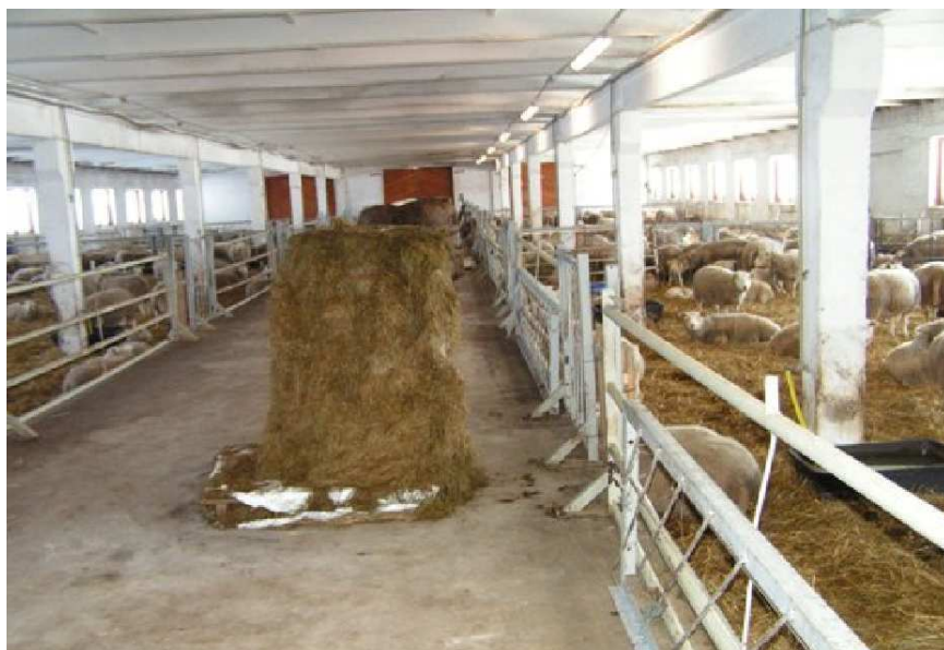
Pilt 13. Lauda sisevaade (P. Piirsalu)

Restpõrandate konstruktsioon peab olema selline, et lambad ei vigastaks oma sõrgasid. Restpõrandate puhul peab materjali laius olema vähemalt 80 mm ja laudade vahe mitte suurem kui 25 mm, Restpõrandaid ei lubata kasutada poegimissulgudes ja tallede pidamiskohtade põrandates.