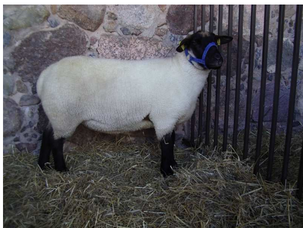
Pilt 1. Eesti tumedapealine (P. Piirsalu)