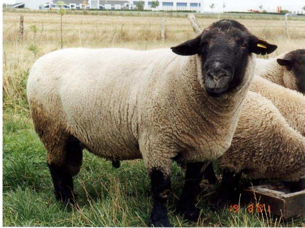
Pilt 4. Suffolk (U. Sellis)

farmi 40 utte ja 5 jäära. Tänapäeval on suffolki lambatõug eesti tumedapealiste lammaste parandaja tõug lihajõudluse ja lihakehade kvaliteedi tõstmisel.