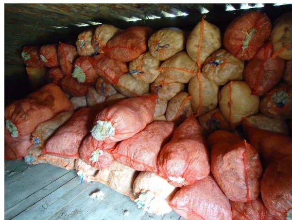
Pilt 11. Õhku läbilaskvad kotid villa säilitamiseks. (P. Piirsalu)