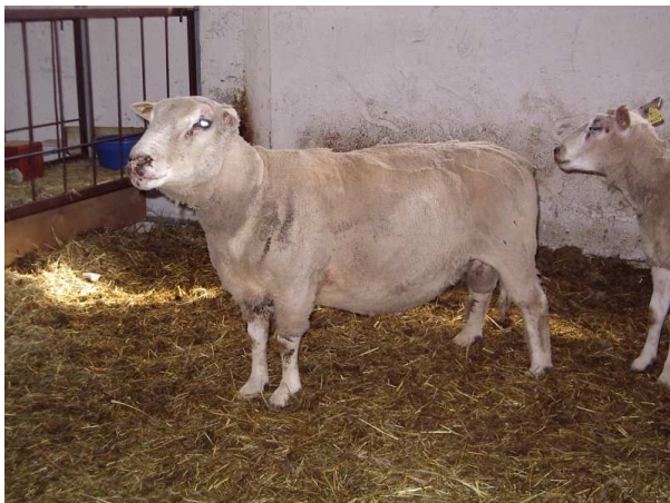
Pilt 7. Nudi dorset (P. Piirsalu)

saadud Inglismaal sellel ajal, kui hispaanlased üritasid vallutada Inglismaad. Nad tõid kaasa oma meriino uttesid, keda pairitati Edela-Inglismaal Walesi sarviliste lammastega. Nii saadi sarviline dorset, kellest hiljem aretati nudi dorset. Tänapäeval kasutatakse valgepealise dorseti puhul nii emas- kui isasloomi. Paljud kasvatajad eelistavad emasloomana just nudi dorsetit, keda ristatakse kas tekseli või suffolki jääradega, et saada järglastelt kõrge kvaliteediga lihakehasid. Dorsetil on üks unikaalne, hinnatav omadus, mille poolest ta erineb teistest lihatõugudest. Nimelt on dorsetile omane pikk innasesoon (vähemalt 8 kuud), mistõttu selle tõuga on võimalik lihtsamini organiseerida tihendatud poegimisi (2 aasta jooksul 3 poegimist), sest uted indlevad ka innavälisel sesoonil (kevad, suvel) palju sagedamini kui teised lihatõugu uted. Inglise keeles on kasutusel termin " out of season " breeding – paaritamine "mitte innasesoonil", mida kasutatakse just dorseti tõu puhul. Dorseti uted on väga heade emaslooma omadustega ja suure piimakusega, seepärast paljud lambakasvatajad eelistavad just neid. Dorseti lambad on keskmise suurusega, pika kere ja hea lihastikuga. Uted on üldiselt teistest lihatõugu uttedest kergemad, kuid nad annavad talledele edasi häid lihavorme, mistõttu neilt saadud lihakehad on hinnatud. Dorseti lambaid kasvatatakse Eestis ühes aretuskarjas ning neid on imporditud Taanist, kui 2001. a imporditi 1 jäär ning 2002. a 4 jäära ja 19 utte.